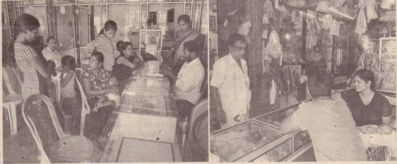
அக்ஷய திருதியை தினம் நேற்று நாடளாவிய ரீதியில் கொண்டாடப்பட்டது. அன்றைய தினம் நகை வாங்கி அணிந்தால் செல்வம் அதிகரிக்கும் என்பது மக்களின் நம்பிக்கையாகும். இதனை முன்னிட்டு நாடளாவிய ரீதியில் உள்ள நகைக்கடைகள் விழாக்கோலம் பூண்டன. அந்த வகையில் நெல்லியடி நகரப்பகுதியில் உள்ள நகைக் கடைகளில் பெருமளவான மக்கள் நகைகளைக் கொள்வனவு செய்தனர். அவற்றைப் படங்களில் காணலாம். (ஆ-11)