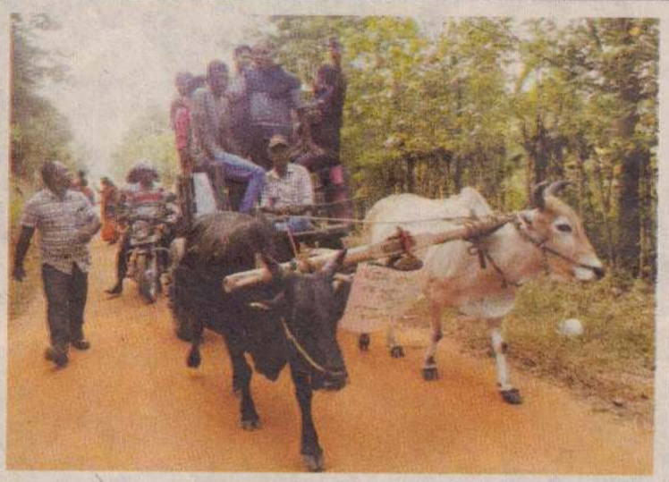
கிளிநொச்சி புண்ணைநீராவி மக்கள் உள்நாட்டிச் சபைத் தேர்தலில் வாக்களிப்ப தற்காக மாட்டு வண்டியில் பயணித்திருந்தனர்.

குரல் 01 அதிர்வு 263 ஞாயிற்றுக்கிழமை பெப்ரவரி 11 2016 ethirolimedia@gmail.com 21224 48