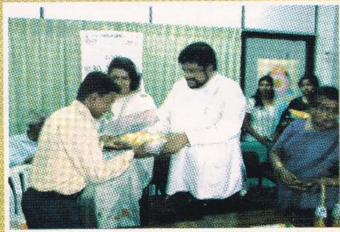
கௌரவ மதவிவகார அமைச்சர் காசோலைகள், சீருடைகள், உபகரணங்களை வழங்குகின்றார்.