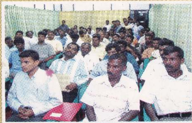
ஆலயங்களிலிருந்தும், நிறுவனங்களிலிருந்தும், அறநெறிப் பாடசாலைகளிலிருந்தும் நிதியுதவி பெற வருகை தந்தோர்.