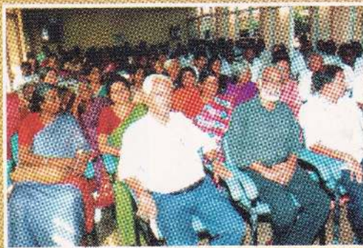
சைவசித்தாந்த வகுப்பு இறுதிநாள் நிகழ்வு, மூன்று நால்களின் வெளியீடு இவைகளில் கலந்து கொண்டோர்.