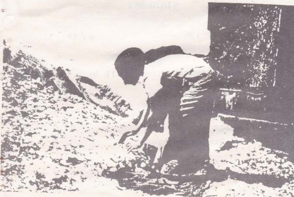
கண்ணாடி தொழிற்சாலையில் கைகளுக்கு உறைகளின்றி கண்ணாடி உள்கும் பெண்.