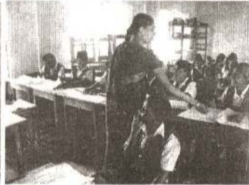
தையல் பயிற்சியின்போது மாணவர்கள்