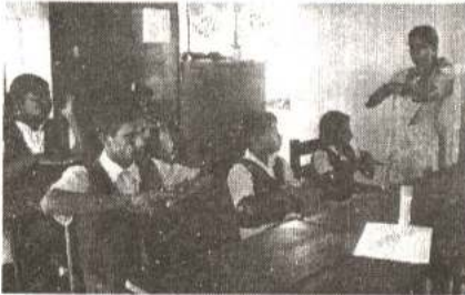
சைகைமொழிப் பயிற்சி அளிக்கப்படுதல்