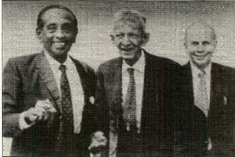
ஜீ. ஜீ. பொன்னம்பலம்

"The Tamil nation must take the decision to establish its sovereignty in its homeland on the basis of its right to self-determination. The only way to announce this decision to the Sinhalese Government and to the world is to vote for TULF. The Tamil-speaking representatives who get elected through these votes while being members of the National State Assembly of Tamil Eelam which will draft a constitution for the state of Tamil Eelam and establish the independence of Tamil Eelam by bringing that constitution into operation either by peaceful means or by direct action or struggle".