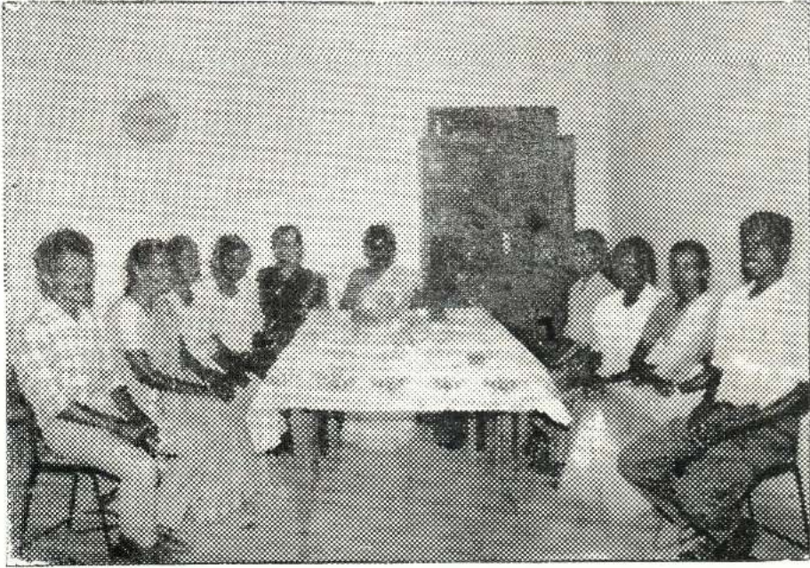
பணியாளர்கள் 1996 ஆம் ஆண்டு