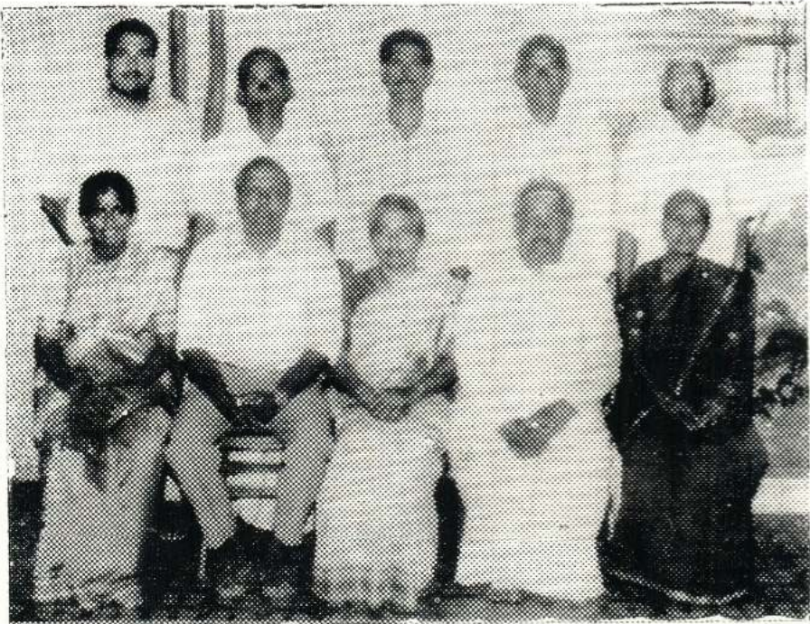
1998-ஆம் ஆண்டு பணிப்பாளர் சபையினரின் ஒரு புகுதி