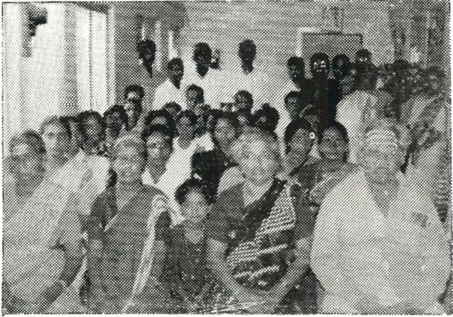
பொதுச் சபையினரில் ஒரு பகுதி