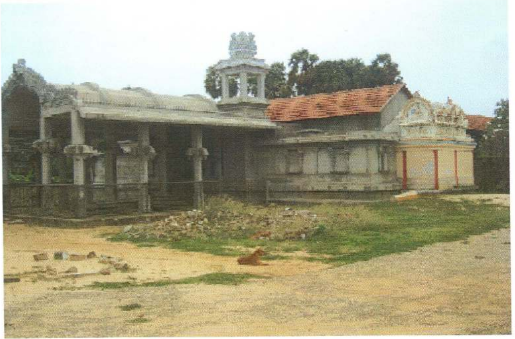
மாறாம்புலம் மாணிக்கப் பிள்ளையார் ஆலய தோற்றம்