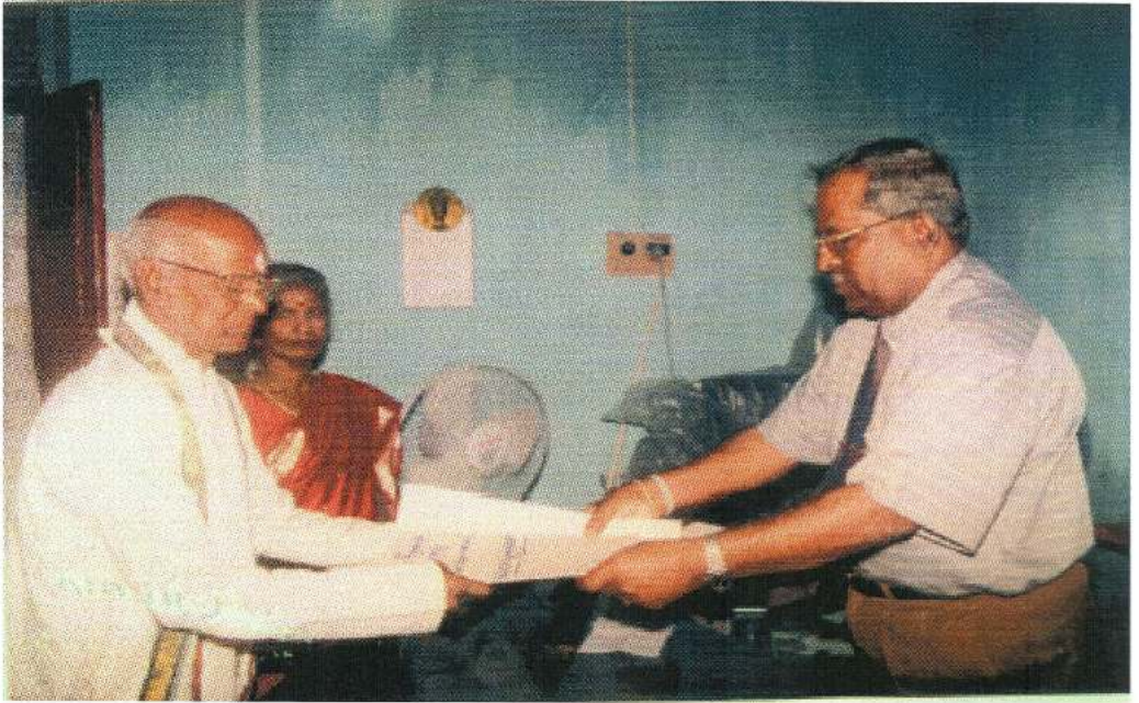
சமாதான நீதவான் பட்டமளிப்பின்போது