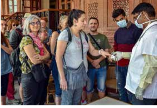
புதுடெல்லி, மார்ச் 12

கொரோனா அச்சுறுத்தல் காரணமாக பிரான்ஸ், ஜேர்மனி, ஸ்பெயின் நாட்டினர் இந்தியா வர தற்காலிகத் தடை விதிக்கப்பட்டுள்ளது. சீனாவின் வுகான் நகரில் வெளிப்பட்ட கொரோனா வைரஸ், உலகம் முழுவதும் நூறுக்கும் மேற்பட்ட நாடுகளில் பரவி அச்சுறுத்தி வருகிறது. இந்தியாவி