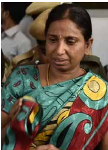
தெரிவிக்கப்பட்டது. இந்நிலையில் இன்று இந்த மனுவை நீதிமன்றம் தள்ளுபடி செய்துள்ளது. இந்த மனு மீதான விசாரணையில் 7 பேர் விடுதலை தொடர்பான தீர்மானத்தில் முடிவெடுக்கும்படி ஆளுநரை கட்டாயப்படுத்த முடியாது என தமிழக அரசு கூறியிருந்த நிலையில் தற்பொழுது நளினியின் மனுவை நீதிமன்றம் தள்ளுபடி செய்துள்ளது.

நீதிமன்றத்தில் ஆள்கொண்டர்வு மனு தாக்கல் செய்திருந்தார். இந்த வழக்கு விசாரணைக்கு வந்தபோது, அமைச்சரவை தீர்மானம் நிறைவேற்றப்பட்ட நாளுக்கு பிறகு நளினி சட்டப்பூர்வக் காவலில் இருக்கிறாரா அல்லது சட்டவிரோத காவலில் இருக்கிறாரா என தெளிவுபடுத்த வேண்டும் என மத்திய, மாநில அரசுகளுக்கு உத்தரவிடப்பட்டிருந்தது. பின்னர், இந்த வழக்கில் பதிலளித்த தமிழக அரசு, 7 பேரின் தூக்கு தண்டனையை ஆயுள் தண்டனையாக குறைத்து உச்ச நீதிமன்றம் உத்தரவிட்டிருப்பதாலும், இந்த வழக்கை சி.பி.ஐ. விசாரணை நடத்தியதாலும் இவர்களின் விடுதலை தொடர்பாக மத்திய அரசின் ஒப்புதல் இல்லாமல் இந்த விவகாரத்தில் தமிழக அரசு முடிவெடுக்க முடியாது என தெரிவிக்கப்பட்டது. இதையடுத்து இந்த வழக்கின் அனைத்து தரப்பு வாதங்களும் கடந்த 20-ஆம் திகதி முடிந்த நிலையில், அந்த வழக்கின் தீர்ப்பு நேற்று அறிவிக்கப்படும் என்று