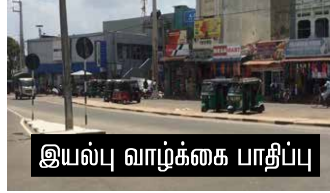
இயல்பு வாழ்க்கை பாதிப்பு

மன்னார், மார்ச் 18 நாடு முழுவதும் மிகுந்த அச்சத்தை ஏற்படுத்திய 'கொரோனா வைரஸ்' தாக்கம் தற்போது இலங்கையிலும் ஏற்பட்டுள்ள நிலையில் மன்னார் மாவட்ட மக்களின் இயல்பு நிலை பாதிக்கப்பட்டுள்ளது. இலங்கை அரசு பல்வேறு தடுப்பு நடவடிக்கைகளை முன்னெடுத்து வரும் நிலையில், மக்களுக்கு வழங்கிய அறிவுறுத்தல்களுக்கு அமைவாக மக்கள் தமது பாதுகாப்பு நடவடிக்கைகளை முன்னெடுத்துள்ளனர்.