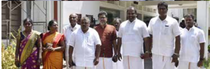
யாழ்ப்பாணம், மார்ச் 19 மனு தாக்கல் செய்தன. யாழ்ப்பாணத்தில் பிரதான தமிழ்த் தேசியக் கூட்டமைப்பு, தமிழ்க் கட்சிகள் நேற்று வேட்பு தமிழ் மக்கள் பக்கம் 03 >>>

சம்பந்தன் தலைமையில் திருமலையில் வேட்புமனு