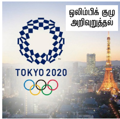
ஒலிம்பிக் குழு அறிவுறுத்தல்

இந்த நிலையில் ஒலிம்பிக் தீபத்தை பெற்றுக்கொள்வதற்காக ஜப்பானில் இருந்து 'ரோக்கியோ 2020' என்ற பெயருடன் சிறப்பு விமானம் நேற்று கிரேக்க நாட்டுக்கு சென்றது. இதன் பின்னர் ஒலிம்பிக் தீபம் டோக்கியோ நகருக்கு கொண்டு வரப்பட்டு உள்ளது.