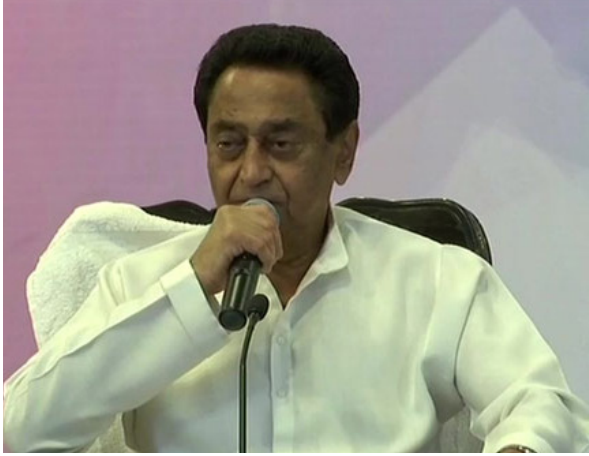
இருந்தது. இந்த பரபரப்பான சூழ்நிலையில், கமல்நாத் வீட்டில் காங்கிரஸ் சட்டமன்ற குழு கூட்டம் நடப்பெற்றது. இக் கூட்டத்திற்கு பிறகு கமல் நாத் செய்தியாளர்களை சந்தித்தார். அப்போது அவர் கூறியதாவது:-

போபால், மார்ச் 21 மத்திய பிரதேச முதல்வர் கமல்நாத், தனது மாநில அரசாங்கம் பெரும்பான்மையை இழந்துள்ள நிலையில், நம்பிக்கை வாக்கெடுப்பை எதிர்கொள்வதற்கு முன்பாகவே ராஜினாமா செய்வதாக நேற்று அறிவித்தார். மத்திய பிரதேசத்தில் ஆளும் காங்கிரஸ் கட்சியில் இருந்து ஜோதிராதித்ய சிந்தியா வெளியேறி பா.ஜ.கவில் இணைந்தார். அவரது ஆதரவு எம்.எல்.ஏக்கள் 22 பேரும் ராஜினாமா செய்தனர். அவர்களில் முதலில் 6 மந்திரிகளின் ராஜினாமாவை மட்டும் சபாநாயகர் ஏற்றார். மற்றவர்களின் ராஜினாமா கடிதங்களைத் தாம் ஏற்றாள் என நேற்று முன்தினம் நள்ளிரவில் அறிவித்தார். இதனால் கமல்நாத் தலைமையிலான அரசு சட்டசபையில் பெரும்பான்மையை இழந்தது. சட்டசபையில் நேற்று மாலை 5 மணிக்குள் அரசு மீதான நம்பிக்கை வாக்கெடுப்பை நடத்தி முடிக்க வேண்டும் என உச்ச நீதிமன்றம் உத்தரவிட்டிருந்த நிலையில் நேற்று நம்பிக்கை வாக்கெடுப்பை நடத்தினால் நிச்சயம் அரசு தோல்வியடையும் என்ற நிலை