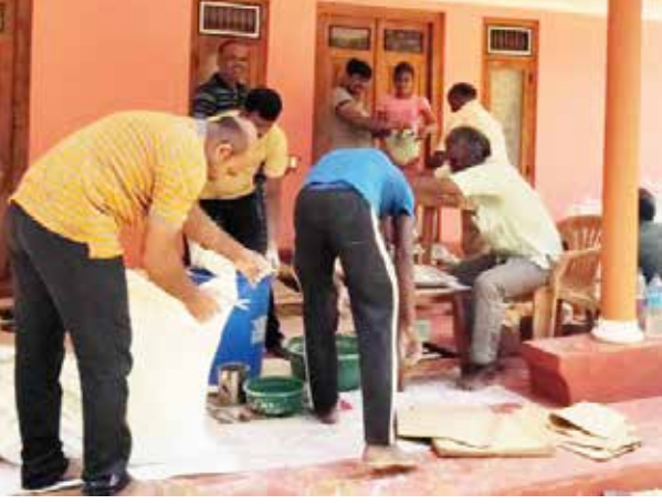
யாழ்ப்பாணம், மார்ச் 31

தென்மராட்சியில் சரசாலை காளி கோவிலின் மணவாளக்கோல உற்சவத் திருவிழாவுக்கான உபய நிதியில் மக்களுக்கான அத்தியாவசியப் பொருள்களை வழங்கிய முன்மாதிரியான செயற்பாடு நேற்று இடம்