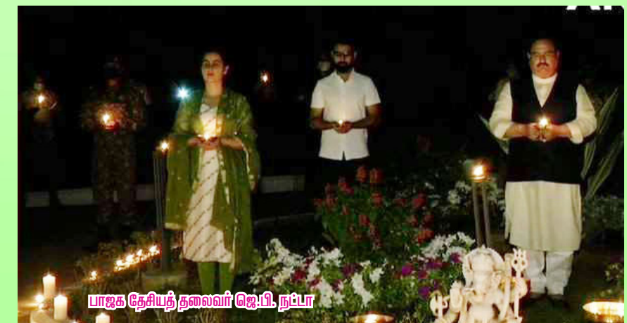
பாஜக தேசியத் தலைவர் ஜெ.பி. நட்பா