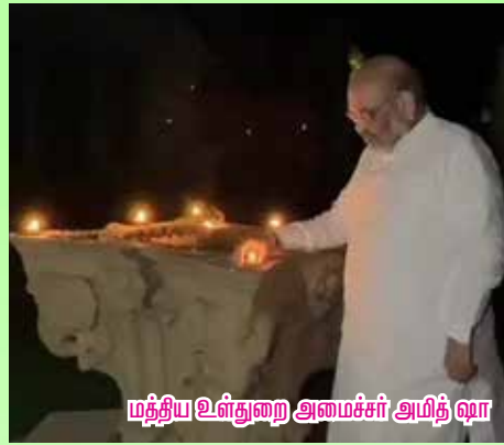
மத்திய உள்துறை அமைச்சர் அமித் ஷா