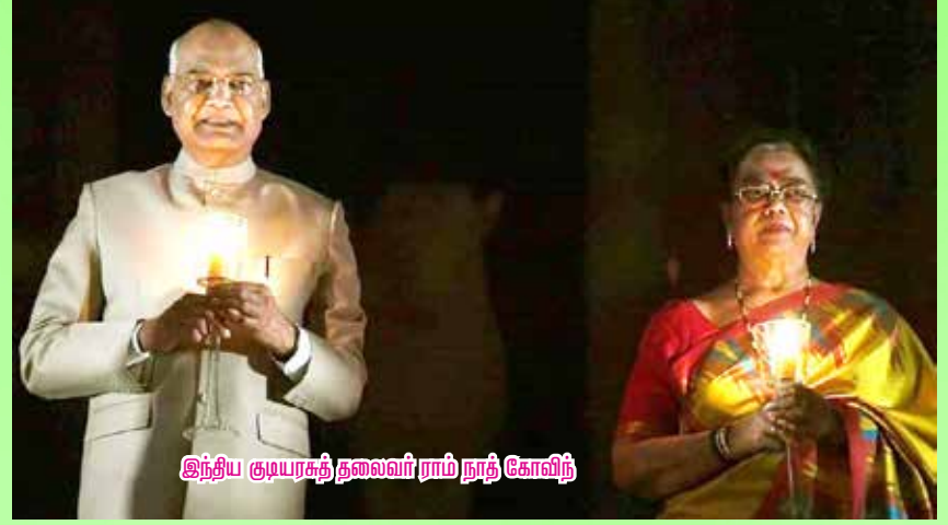
இந்திய குடியரசுத் தலைவர் ராம் நாத் கோவிந்த்

பிரதமர் நரேந்திர மோடியின் வேண்டுகோளை ஏற்று நாட்டு மக்கள் அனைவரும் வீடுகளிலும், கட்டடங்களிலும் விளக்கேற்றினர்.