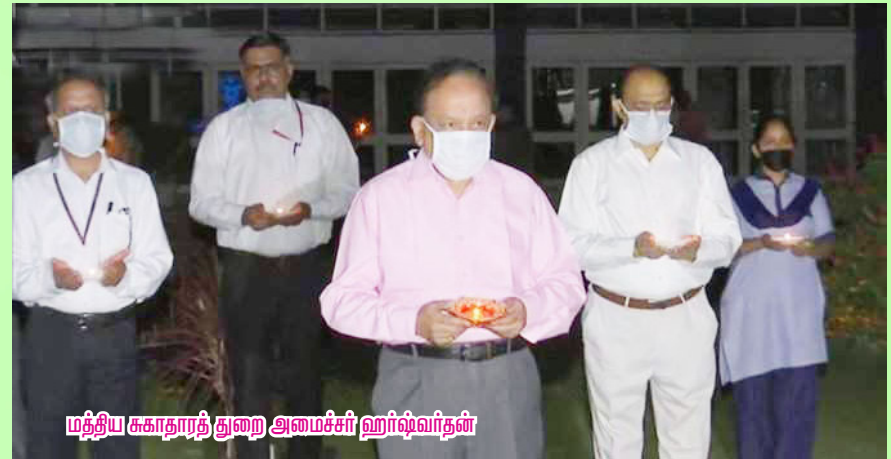
மத்திய சுகாதாரத் துறை அமைச்சர் ஹர்ஷ்வர்தன்