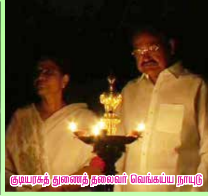
குடியரசுத் துணைத் தலைவர் வெங்கய்ய நாயுடு