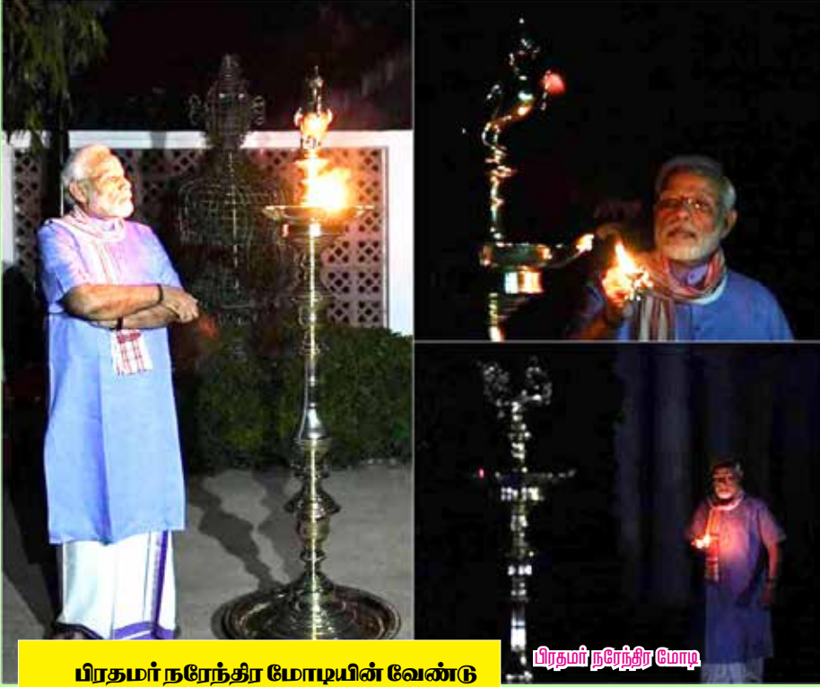
பிரதமர் நரேந்திர மோடி