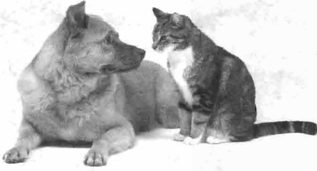
நல்ல நண்பர்கள் எப்பொழுதும் உற்சாகப்படுத்துவார்கள்.

ஒருசிலருக்கு எதிலாகிலும் அதிஷ்டம் அடித்தவுடன் அவர்களைச் சூழ அநேக “நண்பர்கள்” மொய்த்து விடுவார்கள். அதற்கு முன்னர் அவர்கள் நண்பர்களாக பழகியிருந்திருக்கவே மாட்டார்கள். இதனைத்தான் நீதிமொழிகள் 19:6ம் வசனம் கூறுகின்றது. “பிரபுவின் தயையை அநேகர் வருந்திக் கேட்பார்கள்; கொடைகொடுக்கிறவனுக்கு எவனும் சிநேகிதன்”. எனினும் நல்ல நண்பர்கள் தங்கள் நண்பர்களால் இலாபம் அடையலாம் என்ற நோக்கத்துடன் பழகமாட்டார்கள். அவர்கள் உங்களுடைய நட்பினை எதிர்பார்ப்பதற்குக் காரணம், ஏதேனும் இலாபம் பெறும் நோக்கமாக இருக்குமாயின், அல்லது ஏதேனும் தீய நோக்கத்தை நிறைவேற்றுவதற்காக இருக்குமாயின் அவர்கள் ஒருபோதும் நல்ல நண்பர்களாக இருக்கமுடியாது. ஆகவே, உங்கள் நட்பினைப் பெறுவதற்காக பிறர் காத்திருக்கும்படி நடந்துகொள்ளாமல், நட்பு தேவைப்படும் ஒரு சிலரை உங்களுடைய சிறந்த நண்பர்களாகத் தெரிந்தெடுத்துக்கொள்ளுங்கள். ஏதேனும் ஒரு வழிமுறையில் அவர்களுக்குச் சேவைசெய்ய முற்படுங்கள். சுயநலத்துடனான வாஞ்சையிலும் பேராசையிலும் பார்க்க, சுயநலமற்ற சேவை மனப்பான்மையுள்ளவராக மற்றவர்களால் நல்ல நண்பராக தேர்ந்தெடுக்கப்படத்தக்கவராக உங்களை மாற்றிக்கொள்ளுங்கள்.