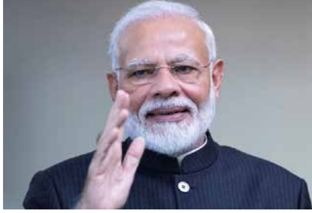
பாதிப்பு குறித்துப் பேசினேன். தென்னாபிரிக்காவுக்குத் தேவையான மருத்துவ உதவிகளுக்கு இந்தியா உதவும் என தெரிவித்துள்ளேன் என்றார்.

“தொலைபேசி மூலம், தென்னாபிரிக்க அதிபர் சிரில் ராமபோசாவுடன் உரையாடியமை குறித்து கருத்து வெளியிட்ட பிரதமர் மோடி” அதிபர் சிரில் உடன் கொரோனா