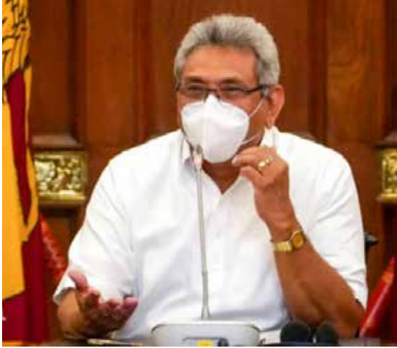
சட்டம் தொடர்ச்சியாக அமுலில் உள்ள பிரதேசங்களில் சேவைகளை பேணுவதற்கான திட்டத்தை தயாரிக்கும்பொழுது ஜனாதிபதி பணிப்புரை வழங்கினார்.

போக்குவரத்து சபைக்கு சொந்தமான பஸ்களின் மூலம் விவசாய அறுவடை களைகிராமங்களில் இருந்து நகரங்களுக்கு கொண்டு வருவதற்கு நடவடிக்கை எடுப்பதன் வாயிலாக விவசாயிகளுக்குப் பாரியநீவாரணம் கிடைக்கும் என்றும் ஜனாதிபதி குறிப்பிட்டார்.