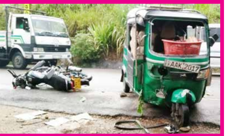
களை நாவலபிட்டி பொலிஸார் மேற்கொண்டுவருகின்றமை குறிப்பிடத்தக்கது.

கினிகத்தேனை கம்பளை பிரதான வீதியில் ஓட்டோ ஒன்றும் மோட்டார் சைக்கிள் ஒன்றும் நேருக்கு நேர் மோதிக்கொண்டதில் ஓட்டோச் சாரதி பரிதாபமாக உயிரிழந்துள்ளார் என நாவலபிட்டி பொலிஸார் தெரிவித்தனர். இந்த சம்பவம் நேற்று முன்தினம் திங்கட்கிழமை மாலை இடம்பெற்றதாக பொலிஸார் கூறினர். கம்பளைபகுதியில் இருந்து கினிகத்தேனை பகுதிக்கு வியாபார நடவடிக்கையில் ஈடுபட்டு விட்டு மீண்டும் வீடு திரும்பிய வேளையிலேயே ஓட்டோச் சாரதி இந்த விபத்தில் சிக்கினார் என்று கூறப்பட்டது. மோட்டார்சைக்கிளைச் செலுத்தி வந்த நபர் பலத்த காயங்களுக்கு உள்ளாகி நாவலபிட்டி வைத்தியசாலையில் அனுமதிக்கப்