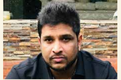
கட்டுரையாளர் - தெய்வீகன்