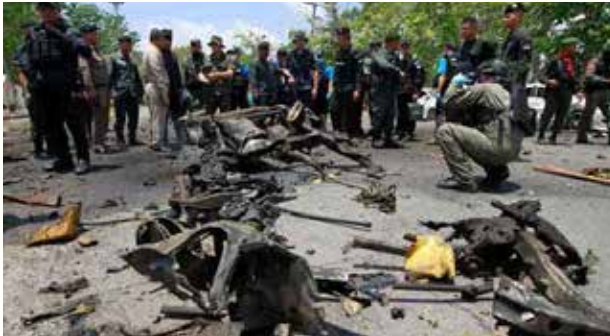
யலா மாகாணத்தில் கொரோனா வைரஸ் தடுப்பு நடவடிக்கைகள் குறித்து அங்குள்ள அரசு அலுவலகத்தில் நேற்று ஆலோசனை கூட்டம் நடைபெற இருந்தது. கூட்டத்தில் பங்கேற்க பல்வேறு அதிகாரிகள் அலுவலகத்திற்கு வந்திருந்தனர். பாதுகாப்பு மற்றும் கொரோனா தடுப்பு நடவடிக்கைகளுக்காகப் படையினரும் வரவழைக்கப்பட்டிருந்தனர்.

ஏனைய நாடுகளைப் போலவே தாய்லாந்திலும் கொரோனா வைரஸின் தாக்கம் பரவி வருகின்றது. அதனைக் கட்டுப்படுத்த அரச அதிகாரிகள் தீவிர நடவடிக்கைகளை முடுக்கி விட்டுள்ளனர்.