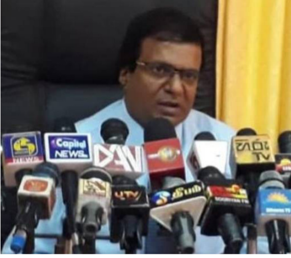
கொரோனா விழிப்புணர்வு நடவடிக்கையில் ஈடுபட்ட உணர்ச்சாவற்றுறை சுகாதார வைத்திய அதிகாரி