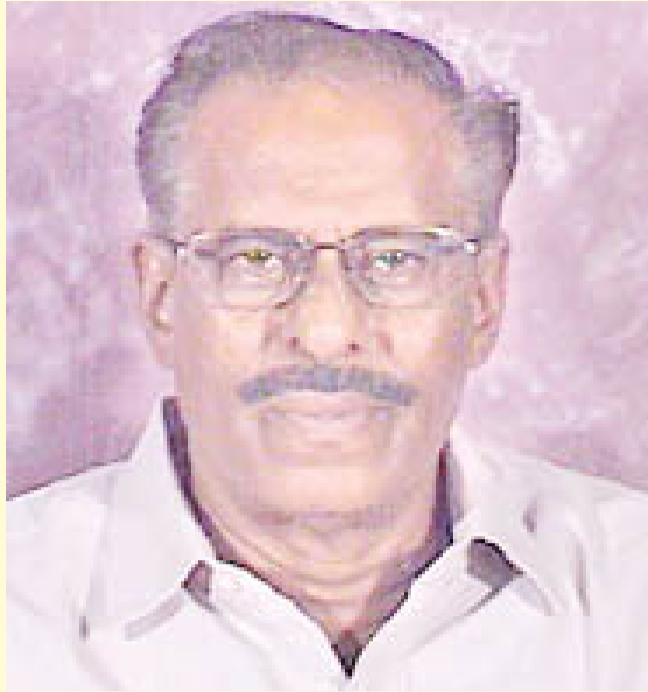
கூட்டமைப்புக்குள் தமிழரசுக் கட்சி சொல்வதும் செய்வதும் தான் இறுதியானது என்கிற நிலை உருவாகிவிட்டது. பங்காளிக் கட்சிகளைச் சரிசமமாக நடத்த வேண்டும் என்கிற எண்ணமோ, அடிப்படை அரசியல் அறமோ அங்கு பேணப்படுவதில்லை. பங்காளிக் கட்சிகளும் அதன் தலைமைகளும்