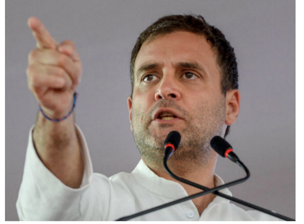
விட்டார் எனத் தெரிவிக்கப்பட்டு அவர் வீடு செல்ல அனுமதிக்கப்பட்டார். இந்த நிலையிலேயே அவர் மீண்டும் மருத்துவ மனையில் சேர்க்கப்பட்டுள்ளார். அவருக்கு கொரோனா பாதிப்பு இன்னும் இருக்கிறதா என்பதற்கான சோதனைகள் தொடங்கப்பட்டுள்ளன.

இதற்கிடையே கொரோனாவால் பாதிக்கப்பட்டு குணமாகினார் என்று வீடு செல்ல அனுமதிக்கப்பட்ட தமிழக இளைஞர் மீண்டும் வைத்தியசாலையில் சேர்க்கப்பட்டுள்ளார். அவர் தனியான மருத்துவ விடுதியில் வைத்து சிகிச்சைக்கு உட்படுத்தப்பட்டுள்ளார் என்று அதிகாரிகள் கூறினர். மஸ்கட்டில் பணிபுரியும் காஞ்சிபுரம் பகுதியைச் சேர்ந்த பொறியாளரான குறித்த இளைஞர் பெப்ரவரி மாதம் 28 ஆம் திகதி நாடு திரும்பினார். விமான நிலையத்தில் அவரைச் சோதித்தபோது அறிகுறிகள் எதுவும் தெரியாத காரணத்தால் அவர் வீடு செல்ல அனுமதிக்கப்பட்டார். ஆனால், பின்னர் காய்ச்சல், இருமல் ஆகிய அறிகுறிகள் தென்பட்டமையால் சோதனைக்குள்ளாக்கப்பட்டார். கொரோனா வைரஸ் பாதிப்பு அவரில் இருந்தது கண்டறியப்பட்டது. தொடர் சிகிச்சைக்குப் பின்னர் நோய் குணமாகி