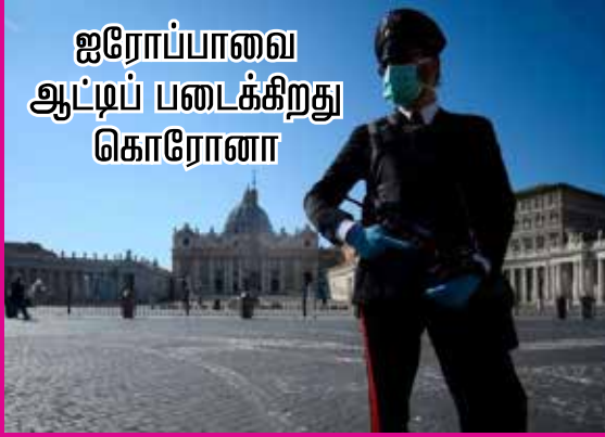
ஐரோப்பாவை ஆட்டிப் படைக்கிறது கொரோனா

சீனாவில் இதுவரை 3 ஆயிரத்து 245 பேர் உயிரிழந்தனர் என்று அறிவிக்கப்பட்டுள்ளது. சீனாவின் உத்தியோகபூர்வமான இந்த அறிவிப்பின் மீது சந்தேகங்கள் இருந்தாலும் இதுவரையில் கிடைக்கப்பெற்ற புள்ளிவிவரங்களின்படி சீனாவின் உயிரிழப்புகளை இத்தாலி தாண்டியிருப்பதாகவே உலக சுகாதார நிறுவனம் உள்ளிட்ட நம்பத் தகுந்த