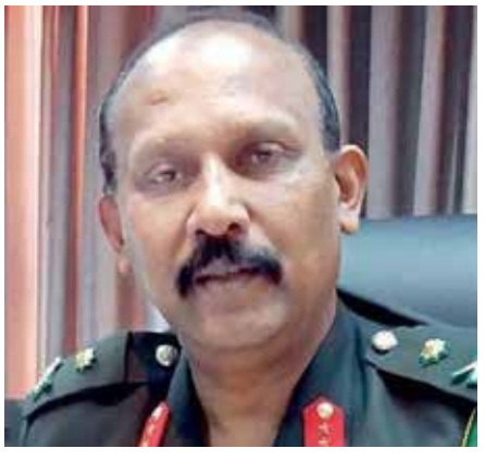
காட்டாக அமைய வேண்டும் என அவர் தெரிவித்தார். வைரஸ் பரவுவதைக் கட்டுப்படுத்தும் அரசாங்கத்தின் முயற்சிகள் தொடர்பான சமூக வலைத்தளங்களில் தவறான புதிவுகளை வெளியிட வேண்டாம் என எச்சரித்த பாதுகாப்பு செயலாளர், புலனாய்வு அமைப்புகளுக்கு அத்தகைய பொறுப்பற்ற நபர்கள் அல்லது குழுக்களை கைது செய்ய அதிகாரம் அளிக்கப்பட்டுள்ளதாகவும் குறிப்பிட்டார்.

வேண்டும். - என்றார். வைரஸ் பரவுவதைக் கட்டுப்படுத்த தனிமைப்படுத்தல் மையங்கள் செயற்படும் என்றும் அவர் கூறினார். நாட்டின் சில பகுதிகளில் அமுல்படுத்தப்பட்ட பொலிஸ் ஊரடங்கு சட்டம் தொடர்பாகக் கருத்து வெளியிட்ட பாதுகாப்புச் செயலாளர், இது மக்களுக்கு வீணான சிரமங்களை ஏற்படுத்த விதிக்கப்பட்ட ஒன்று அல்ல எனவும் வைரஸ் பரவுவதைக் கட்டுப்படுத்தும் வகையில் உயர் ஆயத்து நிறைந்த பகுதிகளில் தேவையற்ற அசைவியக்கங்களையும் நகர்வுகளையும் கட்டுப்படுத்துவதற்காகவே அது பிறப்பிக்கப்பட்டது எனத் தெரிவித்தார். உலகளாவிய தொற்றுநோயாக மாறியுள்ள கொரோனா வைரஸ் பரவுதலை சிறிய தேசம் எவ்வாறு வெற்றிகரமாக தடுத்து நிறுத்தியது என்பதற்கு இலங்கை உலகிற்கு ஒரு சிறந்த எடுத்துக்