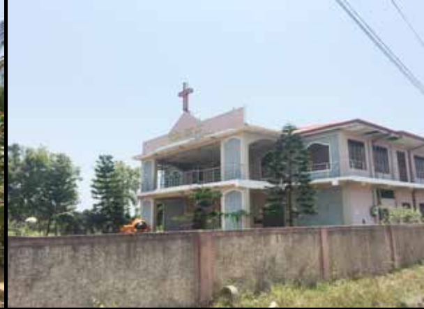
ஆராதனை நடந்த தேவாலயம்