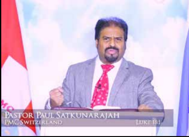
ஆராதனை நடத்திய போதகர்