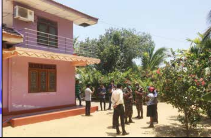
அருகில் அவர் தங்கியிருந்த வீடு