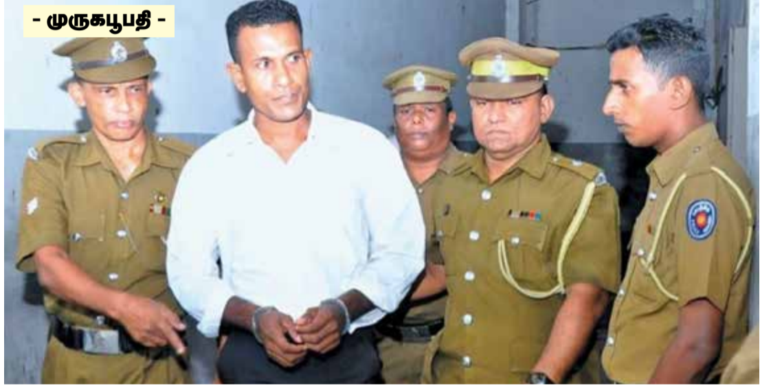
- முருகபதி -

கொழும்பு மேல் நீதிமன்ற நீதிபதி தீபாலி விஜய சுந்தர, எச்.என்.பி.பி.வராவெள, சுனில் ராஜபக்ஷ ஆகிய மூன்று நீதிபதிகளும் பிரதி சட்டமா அதிபர்