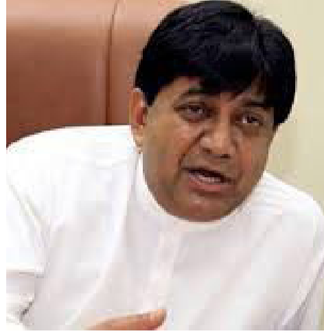
கொழும்பு, ஏப். 06 நாடாளுமன்றத் தேர்தலை நடத்துவ