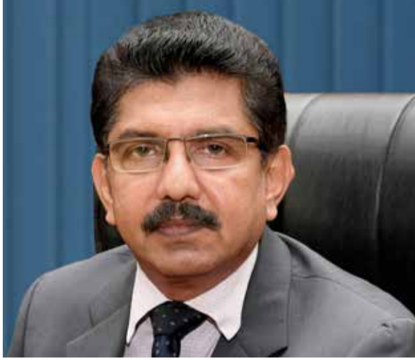
176 பேருக்கு கொரோனா தொற்று உறுதி செய்யப்பட்ட உள்ளமை குறிப்பிடத்தக்கது.