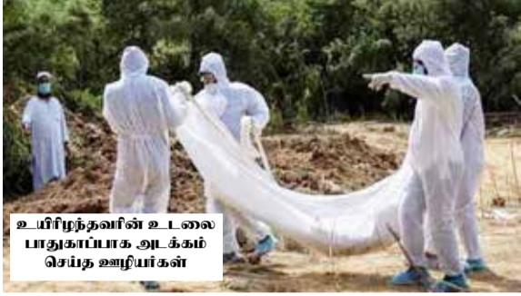
உயிரிழந்தவரின் உடலை பாதுகாப்பாக அடக்கம் செய்த ஊழியர்கள்

வடிக்கைகள் தீவிரமாக நடைபெறுகின்றன. தற்போது கொரோனா பாதிப்பு குறைவாக உள்ள பகுதிகளில் ஊர்பங்கு தளர்த்தப்பட்டுள்ளது. எனினும் பரிசோதனைகளை அதிகரிக்க அதிகாரிகள், புதிய நோயாளிகளின் எண்ணிக்கையும் உயர்ந்து வருகிறது. உயிரிழப்பும் கணிசமாக உயர்கிறது.