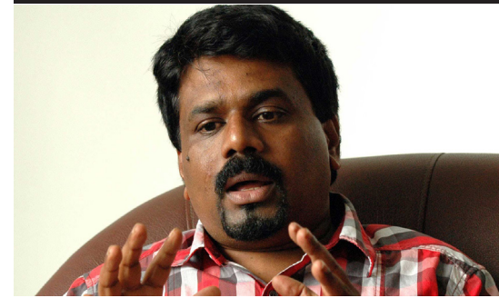
தமிழ்த் தேசியக் கூட்டமைப்பு செயற்படுவதோடு, அதே நிலைப்பாட்டிலேயே மக்கள் விடுதலை முன்னணியும் உள்ளது. - என்றார்.

இந்நிலையில், இவ்விருதரப்பினரது ஆதரவைப் பெறும் முனைப்பில் ஆளும் மற்றும் எதிர்த்தரப்பு தீவிரமாகச் செயற்படுகின்றன.