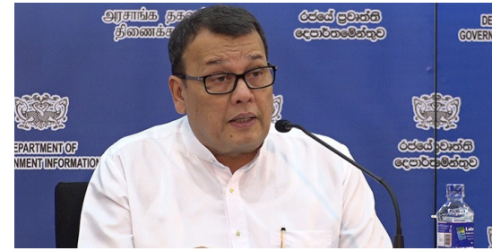
அரசு தகவல் திணைக்களத்தில் நேற்று வியாழக் கிழமை நடைபெற்ற வாராந்த அமைச்சரவை முடிவுகளை அறிவிக்கும் உட்கவியலாளர் மாநாட்டிலேயே அவர் இதனைத் தெரிவித்தார்.