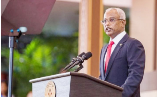
பெறலாமென அமைச்சரவை கூட்டத்தில் கருத்துத் தெரிவிக்கப்பட்டது.

அத்தோடு, மனித உரிமை, கருத்துச் சுதந்திரம் மற்றும் ஜனநாயகத்தை மேம்படுத்தும் விடயங்களில் சர்வதேச நாடுகளுடனான தொடர்பைப் பேணலாம் என்பதையும் சுட்டிக்காட்டியுள்ளனர். அதுமட்டு மன்றி நிலையான அபிவிருத்தி மற்றும் சுற்றுச்சூழல் பாதுகாப்பு விடயங்களிலும் அனுகூலங்களை