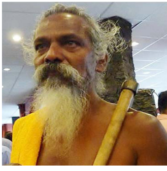
களின் தலைவர் மேலும் கேட்டுள்ளார். (ஐ)

சகல சமயத்தலைவர்களும் ஒன்றிணைந்து நாட்டில் ஏற்பட்டுள்ள நெருக்கடி நிலைமைக்கு தீர்வு காண்பதற்கு அரசியல் தலைவர் களுக்கு ஆலோசனை வழங்க முன்வர வேண்டும் எனவும் ஆதிவாசி