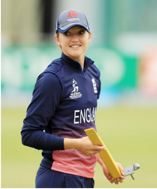
ஆப்கானிஸ்தான் சுழற்பந்து வீச்சாளர் தனக்கு மிகவும் பிடித்த பெண் கிரிக்கெட் வீராங்கனை இங்கிலாந்தைச் சேர்ந்த

முன்னாள் விக்ரெட் கீப்பர் சாரா டெய்லர் எனக் கூறியுள்ளார்.