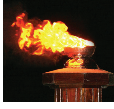
பக்கம் 11 >>>

யாழ்ப்பாணம், நவம்பர் 27 தாயகக் கனவுடன் சாவினைத் தழுவிய வீரமறவர்களான மாவீரர்களுக்குத் தமிழினம் முழுவதுமே திரண்டு அஞ்சலி செலுத்தும் மாவீரர் தினம் இன்றாகும். இன்று மாலை 6.05 மணிக்குத் தாயகமெங்கிலும் புலம்பெயர் தேசங்களிலும் சுடரேற்றப்பட்டு மாவீரர்களுக்கு அஞ்சலி செலுத்தப்படும்.