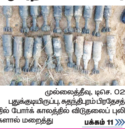
முல்லைத்தீவு, டிசெ. 02 புதுக்குடியிருப்பு, சுதந்திரப் பிரதேசத்தில் போர்க் காலத்தில் விடுதலைப் புலிகளால் மறைத்து பக்கம் 11 >>>