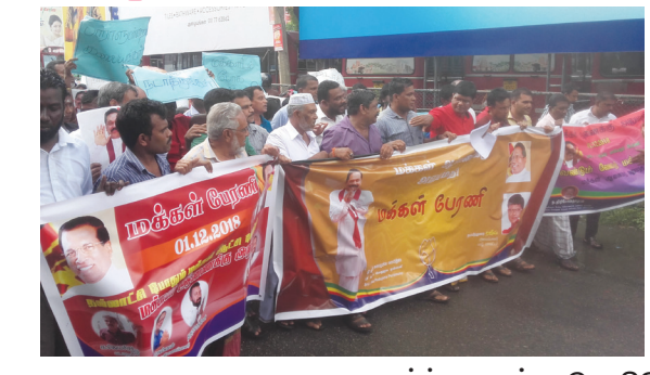
யாழ்ப்பாணம், டிசெ. 02 நாடாளுமன்றத் தேர்தல் விரைவாக நடத்தப்பட வேண்டும் என வலியுறுத்திப் பிரதமர் பக்கம் 11 >>>