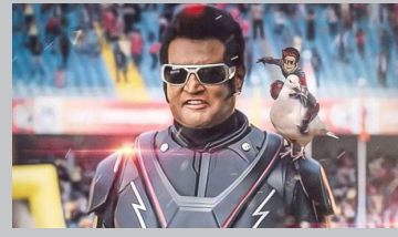
படத்தை பார்த்த அனைவரும் இது ஒரு புது அனுபவம் என்று பாராட்டியுள்ளனர். இந்தநிலையில் படம் வெளியாகிய 4 நாள் களில்

கடந்த வியாழனன்று சுமார் 10 ஆயிரத்திற்கும் மேற்பட்ட திரையரங்குகளில் வெளியாகிய 2.0 முதல் நாள் மட்டும் உலகமெங்கும் இந்தியப் பணத்தில் ரூ.120 கோடியை வசூல் செய்திருந்தது. 3டி தொழில்நுட்பம், 4டி ஓடியோ மற்றும் கிராபிக்ஸ் காட்சிகளுக்கு முக்கியத்துவம் தந்து ஹொலிவுட் படங்களுக்கு இணையாகப் படம் உருவாக்கப்பட்டுள்ளது.