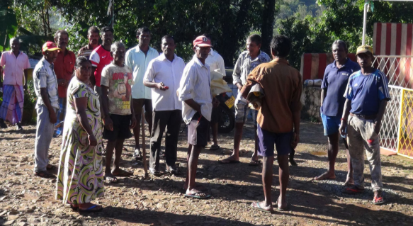
கொழும்பு, டிசெ. 05

தோட்டத் தொழிலாளர்களுக்கு ஆயிரம் ரூபா சம்பள உயர்வை வழங்குவதற்குப் பெருந்தோட்டக் கம்பனிகள் மறுப்பு தெரிவித்துவருவதால் - அதற்கு எதிர்ப்பு வெளியிடும் வகையில் மலையகமெங்கும் நேற்றுப் பணிப்புறக்கணிப்புப் போராட்டம் முன்னெடுக்கப்பட்டது.