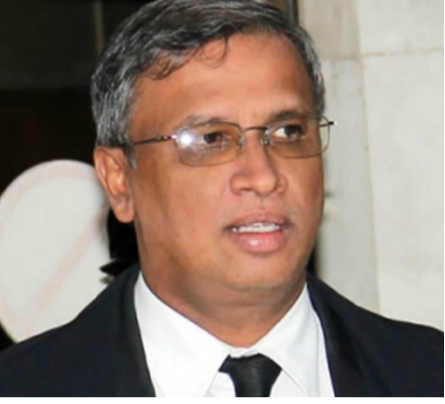
கொழும்பு, டிசெ. 05