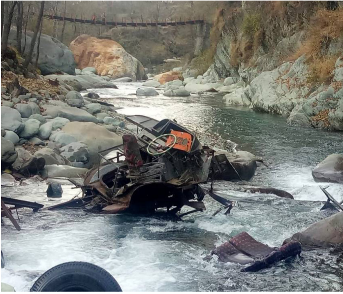
பள்ளத்தில் உருண்டு சுக்குநூறான பஸ்ஸின் உடைந்த ஒரு பகுதி.