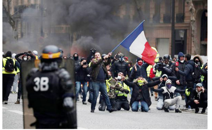
முக்கிய வழித்தடமான போர்ட்டே மெய்லட்டில் போராட்டக்காரர்கள் தடைகளை ஏற்படுத்தினர். மஞ்சள்