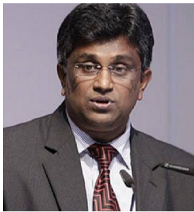
கொழும்பு, டிசெ. 10 ஜனாதிபதி மைத்திரிபால சிறிசேன மற்றும் மஹிந்த ராஜபக்ஷ ஆகியோரால் நாடாளுமன்ற உறுப்