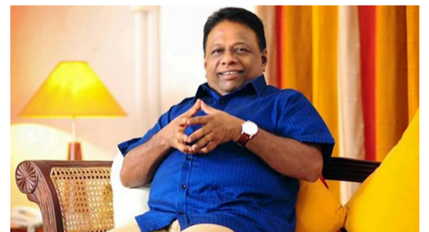
யைக் கொண்டுவர முடியும் - என்றார். (ஐ)

அவர் மேலும் கூறுகையில் - நிறைவேற்று அதிகாரத்திற்கும் சட்டநெறிமுறைகளுக்கும் இடையில் நிலவும் பிரச்சினைக்குத் தீர்வாக ஒரு ஆணைக்குழுவை அமைத்து அதன்மூலம் உண்மை