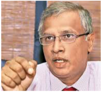
கூட்டமைப்பு ஆதரவு வழங்கியது.

ரணில் விக்கிரமசிங்கவைப் பிரதமராக நியமிப்பதற்கு, எந்த உடன்பாடும் செய்துகொள்ளப்படாமலேயே