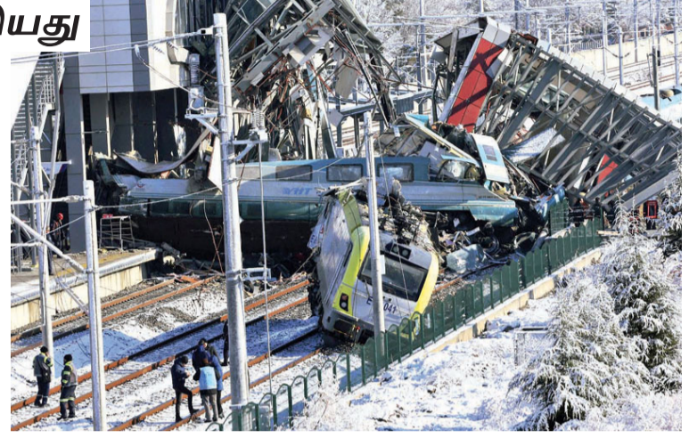
சில மணி நேரம் ரயில் போக்குவரத்து பாதித்தது.

விபத்துக்குறித்து தகவல் அறிந்ததும் மீட்புபடையினர் விரைந்து சென்று மீட்புப் பணிகளில் ஈடுபட்டனர். படுகாயம் அடைந்தவர்கள் மீட்கப்பட்டு அம்புலன்ஸ்களில் ஆஸ்பத்திரிகளுக்கு அனுப்பி வைக்கப்பட்டனர். இந்த விபத்துக்காரணமாக அந்ததடத்தில்