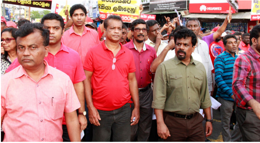
ஆதரவை வழங்கியிருந்தாலும், சுதந்திரக்கட்சி, கூட்டு எதி

அரசமைப்பின் 20 ஆவது திருத்தச்சட்டவரைவை -தனி நபர் பிரேரணையாக ஜே.வி.பி. நாடாளுமன்றத்தில் சமர்ப்பித்திருந்தது. இந்தச் சட்டமூலத்துக்கு ஐக்கிய தேசியக் கட்சி