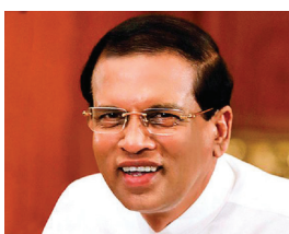
ரிபால சிறிசேன தெரிவித் துள்ளார். தாய்நாட்டின் எதிர்கால நன்மை பக்கம் 11 >>>

வாக்கு தற்போது எமது நாட்டின் மீது செலுத்தப்படு கிறது. அத்தகைய சவால் களை முறியடிக்க அனை வரும் அணி திரளவேண் டும் என ஜனாதிபதி மைத்தி