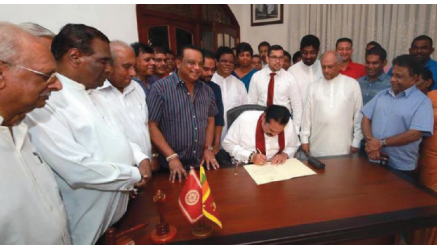
கொழும்பு, டிசெ. 16 பிரதமர் பதவியில் இருந்து தாம்

விலகிவிட்டார் என, மஹிந்த ராஜபக்ஷ எம்.பி. நேற்று அறிவித்தார். மஹிந்தவின் விஜேராம மாவத்தை இல்லத்தில் நேற்று முற்பகல் நடைபெற்ற ஐக்கிய மக்கள் சுதந்திர முன்னணியின் நாடாளுமன்ற உறுப்பினர்களின் கூட்டத்தி லேயே அவர் இதனைத் தெரிவித்துள்ளார். அந்தக் கூட்டத்தில், அவரது ஆதர வாளர்களான நாடாளுமன்ற உறுப்பினர் கள் மத்தியில், பதவி பக்கம் 11 >>>