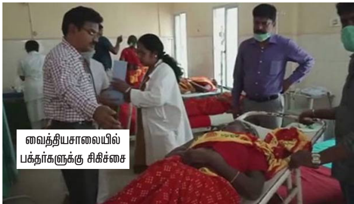
வைத்தியசாலையில் பக்தர்களுக்கு சிகிச்சை

இந்தத் தக்காளிச் சாதத்தைச் சாப்பிட்ட சிறிது நேரத்தில் பலர்