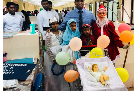
கிளிநொச்சி, டிசெ. 17

யாழ்ப்பாணம் போதனா வைத்திய சாலையின் கத்தோலிக்கத் திருச்சபையினதும், வெளிச்சம் வாழ்வியல் வளர்ச்சி அமைப்பினதும் ஏற்பாட்டில் யாழ்ப்பாணம் போதனா வைத்தியசாலையில் நத்தார் தினத்தை முன்னிட்டு அன்பளிப்புப்பொருள்கள் வழங்கப்பட்டன.