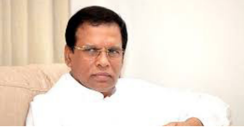
கொழும்பு, டிசெ. 17

ஸ்ரீலங்கா பொதுஜன பெரமுனவுடன் இணைந்து தம்மால் எதிரணியில் அமரமுடியாது என ஸ்ரீலங்கா சுதந்திரக் கட்சியின் 21 நாடாளுமன்ற உறுப்பினர்கள் ஜனாதிபதியிடம் திட்டவட்டமாகத் தெரிவித்துள்ளனர். ஜனாதிபதி செயலகத்தில் இடம்பெற்ற சந்திப்பொன்றின் பின்னர் ஜனாதிபதி மைத்திரிபால சிறிசேனவுக்கு அதிர்ச்சி காத்திருந்தது. ஸ்ரீலங்கா சுதந்திரக்கட்சியின் 21 நாடாளுமன்ற உறுப்பினர்கள் அவருடன் தனியாகப் பேசுவதற்காக கூட்டம் முடிவடைந்த பின்னரும் காத்திருந்தனர்.