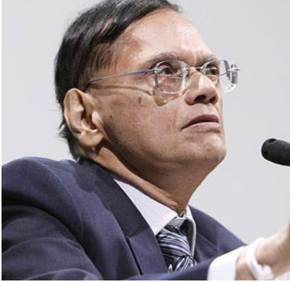
கொழும்பு, டிசெ. 17

இலங்கை வரலாற்றில் முதல் முறையாக ஒரு அரசைத் தமிழ்த் தேசியக் கூட்டமைப்பு கட்டுப்படுத்தப்