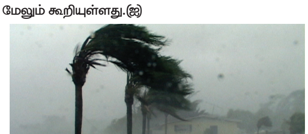
மேலும் கூறியுள்ளது. (ஐ)

தென்மேற்கு வங்காள விரிகுடாவில் உருவாகிய சூறாவளி வடக்கு - வடமேற்கு திசையில் இலங்கையை விட்டு விலகி நகரக்கூடிய சாத்தியம் காணப்படுகின்றது. இதன் தாக்கம் நேற்றிலிருந்து படிப்படியாகக் குறைவடையும் என எதிர்பார்க்கப்படுவதாக வளிமண்டலவியல் திணைக்களம் விடுத்த அறிக்கையில் தெரிவிக்கப்பட்டுள்ளது. நாடு முழுவதும் சீரான வானிலை நிலவும். ஓரளவு குளிரான வானிலையும் எதிர்பார்க்கப்படுவதாக அது