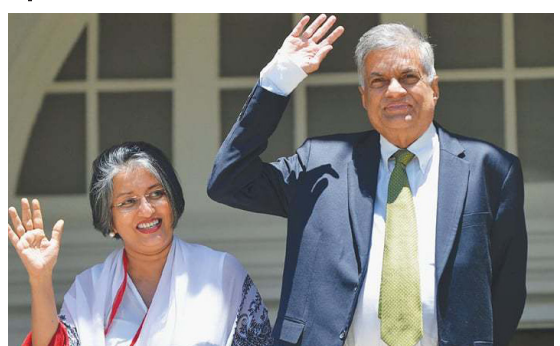
விக்கிரமசிங்க 2 இரவுகள் மாத்திரமே அலரி மாளிகையில் தங்கியுள்ளார். ஆயினும் ஒக்ரோபர் 26ஆம் திகதிக்குப் பின்னர் அவர் முழு நேரமும் அங்கேயே தங்கியிருந்துள்ளார். நேற்றுமுன்தினம் பிரதமராகப் பதவியேற்ற பின்னர் மீண்டும் அவர் தனது வீட்டுக்குச் சென்றுள்ளார். (ஐ)