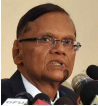
கொழும்பு, டிசெ. 18 ஐக்கிய மக்கள் சுதந்திரக் கூட்டமைப்பு நாடாளுமன்றத்தின் எதிர்க்கட்சியாகச் செயற்படுவதற்கு அதிக உறுப்பினர்களைக் கொண்டிருப்பதால், எதிர்க்கட்சித் தலைவர் பதவி ஐக்கிய மக்கள் சுதந்திரக் கூட்டமைப்புக்கே வழங்கப்படவேண்டுமெனச் சபாநாயகரை வலியுறுத்தவுள்ளதாக ஸ்ரீலங்கா பொதுஜன பெரமுன கட்சியின் தலைவர் ஜி. எல். பிரிஸ் தெரிவித்தார்.

கொழும்பில் நேற்று இடம்பெற்ற ஊடகவியலாளர் சந்திப்பிலேயே அவர் இவ்வாறு கூறினார். அவர் மேலும் தெரிவிக்கையில் -