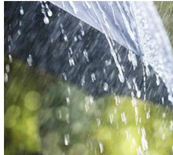
மழை பெய்யுமெனவும் வளிமண்டலவியல் திணைக்களம் கூறியுள்ளது. (ஜ)

கொழும்பு, டிசெ. 21 நேற்று முதல் 22ஆம் திகதி வரை மழையுடனான காலநிலை தொடருமென எதிர்பார்க்கப்படுவதாக வளிமண்டலவியல் திணைக்களம் எதிர்வு எதிர்வு கூறியுள்ளது. இதன்படி வடக்கு, வடமத்திய மற்றும் கிழக்கு ஆகிய மாகாணங்களில் அதிக மழை பெய்யக் கூடுமென்றும், அத்தோடு மத்திய, சப்ரகமுவ ஆகிய மாகாணங்களிலும் மற்றும் காலி, மாத்தறை ஆகிய மாவட்டங்களிலும் இடியுடன் கூடிய பலத்த