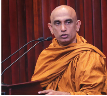
வீழ்த்த விரும்பவில்லை. காபந்து

பெரும்பான்மை இல்லாத அரசேதற்போது உள்ளது. இதனை