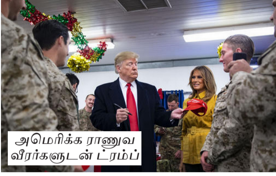
அமெரிக்க ராணுவ வீரர்களுடன் ட்ரம்ப்

அமெரிக்க அதிபரான பிறகு ஈராக்குக்கான தனது முதல் பயணத்தைத் திடீரென மேற்கொண்டிருக்கிறார் டொனால்ட் ட்ரம்ப். இந்தப் பயணத்தில் அமெரிக்க அதிபர் ட்ரம்ப்பின் அவரது மனைவி மெலானியா ட்ரம்பும் சென்றிருக்கிறார்.