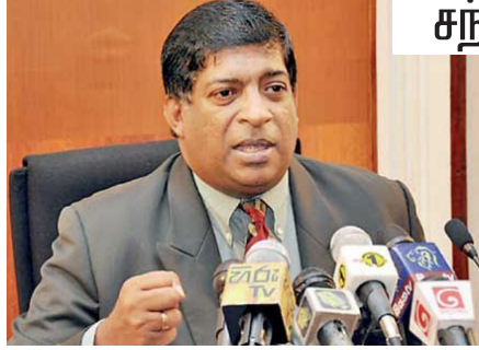
ராக நியமிக்கப்பட்டபோது ரூபாவின் பெறுமதியில் வீழ்ச்சி குறைந்திருந்தது.

கொழும்பு, டிசெ. 30 மத்திய வங்கியில் சில மறைக்கப்பட்ட நிகழ்ச்சித்திட்டம் முன்னெடுக்கப்படுகிறதா? என்ற சந்தேகம் எழுந்துள்ளது. மின் வலுத் துறை அமைச்சர் ரவி கருணாநாயக்க இந்தச் சந்தேகத்தை வெளியிட்டுள்ளார். அவர் மேலும் தெரிவிக்கையில் - பொருளாதாரத்தைப் பாதிக்கும் வகையில் ரூபாவின் பெறுமதி வீழ்ச்சியை மத்திய வங்கியில் சிலர் தமது கட்டுப்பாட்டுக்குள் வைத்திருக்கிறார்கள் போல் உள்ளது. மஹிந்த ராஜபக்ஷ சட்டவிரோத பிரதம