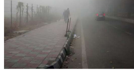
இரண்டு சொகுசு கார்கள் மீது மோதியது. அம்பாலா அருகே நிகழ்ந்த

இந்தவிபத்தில் 7 பேர் உயிரிழந்தனர். 4 பேர் காயமடைந்தனர். உயிரிழந்தவர்கள் சண்டிகரைச் சேர்ந்தவர்கள் என்பது தெரியவந்துள்ளது. இதேபோல் திங்கட்கிழமை ஜஜ்ஜார் மாவட்டத்தில் உள்ள தேசிய நெடுஞ்சாலையில் வாகனங்கள் ஒன்றுடன் ஒன்று மோதியதில் 8 பேர் பலியானமை குறிப்பிடத்தக்கது.