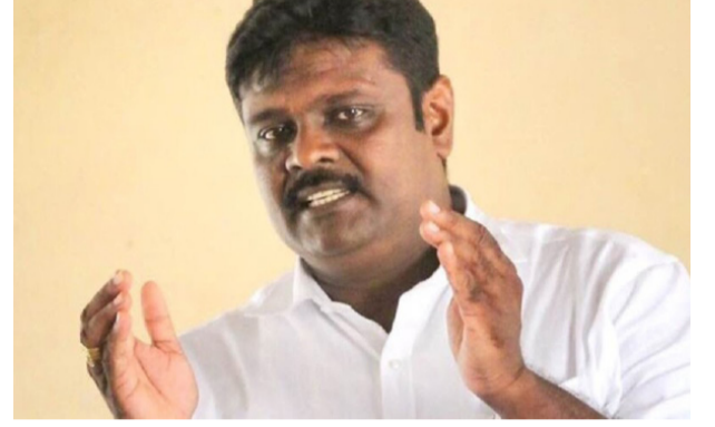
எின் ஜனநாயக வாழ்க்கைக்கு இடையூறற்ற வகையில் இராணுவம் வெளியேறவேண்டும்.

ஏற்கனவே, 1980ஆம் ஆண்டுக்கு முற்பட்ட காலத்தில் இருந்த இராணுவ முகாம்கள் தவிர அதற்குப் பின்னர் போர் காரணமாக உருவாக்கப்பட்ட இராணுவ முகாம்கள் அகற்றப்பட்டு, மக்கள்