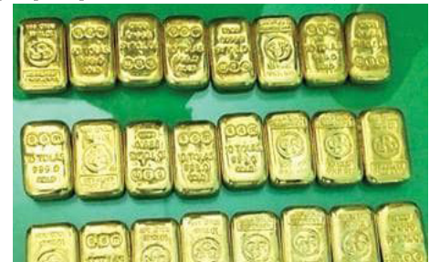
டுத்தப்பியிருக்கலாம் எனச் சந்தேகிப்பதாக தெரிவித்தனர்.

அந்த நேரத்தில் அவ்வழியாக தங்கக் கட்டிவந்த கடத்தல்காரர்கள் பொலிஸாருக்குப் பயந்து, தங்கக் கட்டிகள் இருந்த அந்தப் பையைச் சாலையோரத்தில் வீசிவிட்