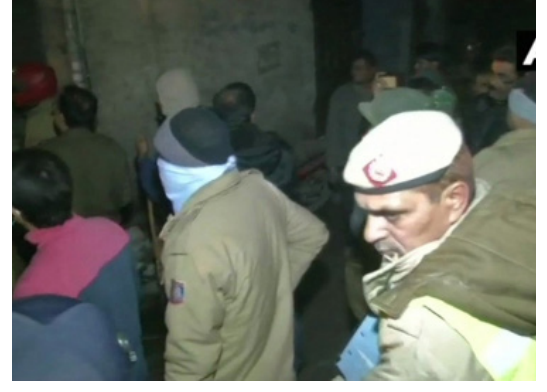
இன்னும் சிலர் சிக்கியிருக்கக் கூடும் என்று கூறப்படுகிறது.

அவர்களில் 5 வயது குழந்தை உள்பட 7 பேர் பலியாகினர். 4 பேரின் நிலைமை கவலைக்குரிய வகையில் உள்ளது. அவர்கள் சப் தர்ஜங்க் மருத்துவமனைக்கு சிகிச்சைக்காக கொண்டு செல்லப்பட்டு உள்ளனர். கட்டடத்தின் இடிபாடுகளில்