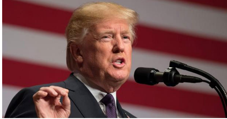
கடந்த நவம்பர் மாதம் ஆப்கானிஸ்தானுக்கான புதிய கொள்கையை வெளியிட்ட டிரம்ப், பயங்கரவாத ஒழிப்பு நடவடிக்கையில் பாகிஸ்தான் இரட்டை வேடம் போடுவதாகவும், அந்நாட்டுக்கு வழங்கப்பட்டுவரும் ஆயிரத்து 300 கோடி டொலார் (இலங்கைப் பணத்தில் சுமார் 2 லட்சத்து 35 ஆயிரம் கோடி ரூபா) நிதி நிறுத்தப்படுவதாக அறிவித்தார்.

இது தொடர்பாக பாகிஸ்தானை வெளிப்படையாக கண்டித்த ஜனாதிபதி டிரம்ப், பாகிஸ்தானுக்கு அளித்து வந்த கோடி கணக்கிலான அமெரிக்காவின் பெரும் நிதி உதவிகளை நிறுத்தினார்.