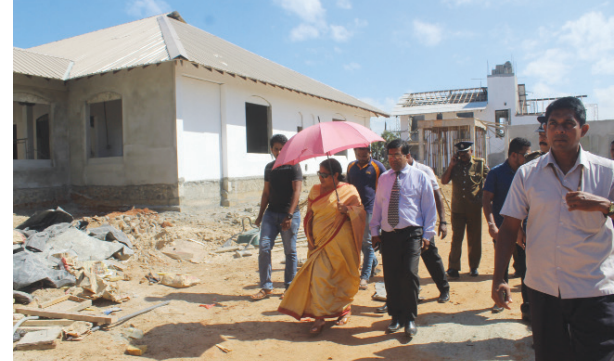
முல்லைத்தீவு, ஜன. 04 முல்லைத்தீவு மாவட்டத்துக்கு நேற்றுப் பயணம் மேற்கொண்ட நீதி மற்றும் சிறைச் பக்கம் 11 >>>

நீதிமன்றக் கட்டடப் பணியை நேற்று முல்லையில் பார்வையிட்டார் துவதா