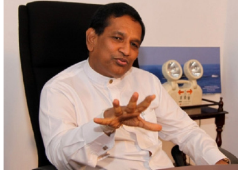
கொழும்பு, ஜன. 08 அதிகாரப் பகிர்வின் முழுமையான அர்த்தத்தைப் புரிந்து கொள்ளாதவர்கள்