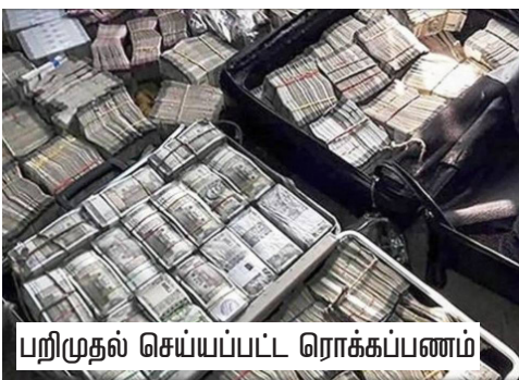
பறிமுதல் செய்யப்பட்ட ரொக்கப்பணம்

இந்தச் சோதனையில் தயாரிப்பு நிறுவனங்கள், தயாரிப்பாளர்கள், திரைப்பட நித. உதவியாளர்கள், நடிகர்கள் ஆகியோரின் வீடுகள், அலுவலகங்களில் சோதனை நடந்தது.