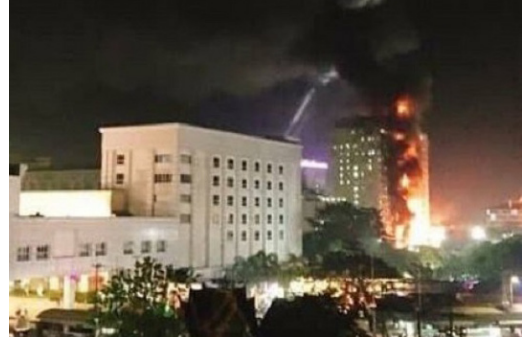
அத்துடன், தீ விபத்தினால் ஏற்பட்ட சேத விவரங்களை கணக்கிடுவதற்குரிய நடவடிக்கைகள் ஆரம்பிக்கப்பட்டுள்ளதாகவும் கூறப்படுகின்றது. (ஐ)

கம்போடியாவிலுள்ள 18 மாடி கூதாட்ட விடுதி ஒன்றில் ஏற்பட்ட தீ விபத்தில் 10 இற்கும் மேற்பட்டவர்கள் காயமடைந்துள்ளனர். தாய்லாந்து எல்லைக்கு அருகில் அமைந்துள்ள ஜென்ரிங் குறோன் என்ற கூதாட்ட விடுதியிலேயே இந்த தீ விபத்து ஏற்பட்டுள்ளது. இதன்போது 10 இற்கும் மேற்பட்டவர்கள் காயமடைந்துள்ளனர் எனவும், காயமடைந்தவர்கள் சிகிச்சைகளுக்காக வைத்தியசாலையில் அனுமதிக்கப்பட்டுள்ளனர் என்றும் தெரிவிக்கப்படுகின்றது. தீ விபத்து ஏற்பட்டமைக்கான காரணம் இதுவரை கண்டறியப்படாத நிலையில் மேலதிக விசாரணைகள் ஆரம்பிக்கப்பட்டுள்ளதாக குறிப்பிடப்படுகின்றது.