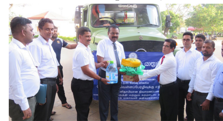
கிளிநொச்சி, ஜன. 11

இலங்கை மகாவலி அதிகார சபையின் எச் பிரிவின் அனுசரணையுடன் மக்களால் கையளிக்கப்பட்ட நிவாரணப் பொருள்கள் நேற்று முன் தினம் கிளிநொச்சியை வந்தடைந்தன. கிளிநொச்சி மாவட்டத்தில்