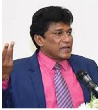
கொழும்பு, ஜன. 11