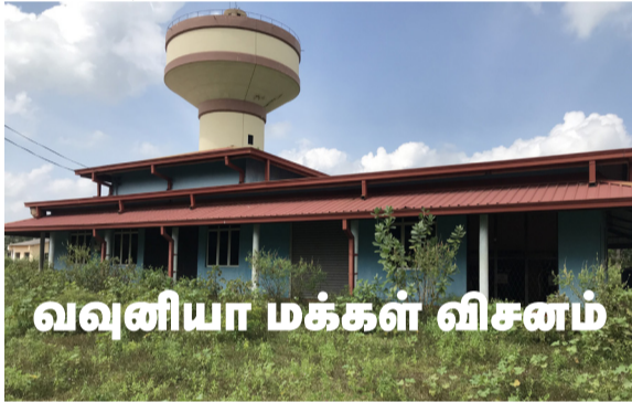
வவுனியா மக்கள் விசனம்