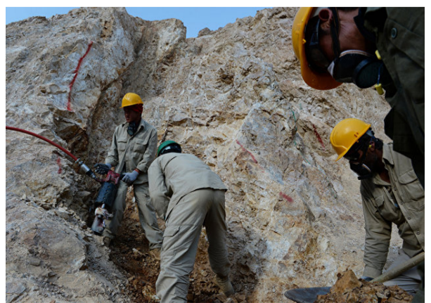
விபத்து ஏற்படுவது குறிப்பிடத்தக்கது.