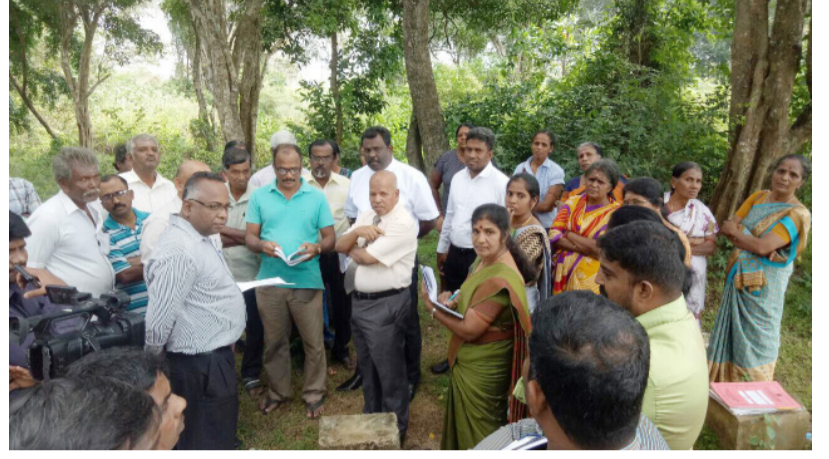
முன்வைத்தனர். இது தொடர்பில் அனைத்து பிரச்சினைகளுக்கும் விரைவில்

கொள்ளப்பட்ட முத்தரப்பு ஒப்பந்தத்தின் பிரகாரம் புதிதாக வழங்கப்பட்ட காணிகளுக்கு ஆவணம் வழங்கல், வயல்பாதைகள் அமைத்தல், காணி அளவீட்டுப்பிரச்சினைகள், கால்வாய் வேலைகள், அணைக்கட்டில் இருந்து வெளியேறும் மேலதிக நீரை மூன்று குளங்களுக்கும் பாய்ச்சுதல், திட்டத்தில் பாதிக்கப்பட்ட குடும்பங்களைச் சேர்ந்தவர்களுக்கு வேலை வாய்ப்பு வழங்கல் போன்ற விடயங்கள் தொடர்பில் விவசாயிகள் கோரிக்கைகளை