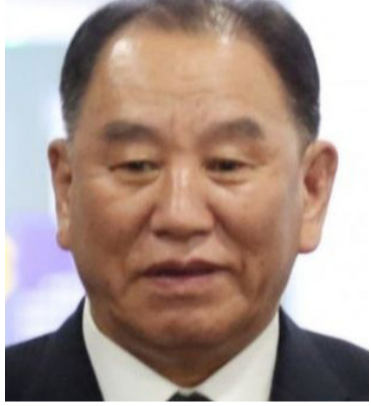
சென்றதாக தென் கொரிய ஊடக

கிம் யோங் - சோல் என்ற அந்த வட கொரிய பேச்சுவார்த்தையாளர் சீனாவின் தலைநகரான பீஜிங்கிலிருந்து அமெரிக்க ஜனாதிபதி டிரம்ப்-க்கு ஒரு கடிதத்தை கொண்டு