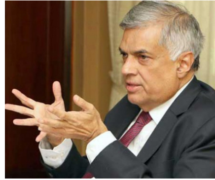
கூடிய அரசமைப்பு முன்வைக்கப்பட வேண்டும் என மஹிந்த குறிப்பிட்டிருந்தார். நாமும் அதே நிலைப்பாட்டில்

ஏன்! சட்டமூலம் கூடத் தயாரிக்கப்படவில்லை. சட்டமூலம் தயாரிக்கப்பட வேண்டும் என்றால் அரசமைப்பு நிர்ணயச் சபையில் அதற்கு மூன்றிலிரண்டு பெரும்பான்மை ஆதரவு அவசியம். அது கிடைக்குமா அல்லது இல்லையா என்பது தெரியவில்லை. கட்சித் தலைவர்கள் தான் அதை தீர்மானிக்க வேண்டும். முன்னாள் ஜனாதிபதி மஹிந்த தைப்பொங்கல் தினத்தை முன்னிட்டு தமிழ்மொழியில் வாழ்த்து தெரிவித்து உரையாற்றினார். அது சிறப்பான செயல். சிங்கள, தமிழ், முஸ்லிம் என அனைத்து மக்களும் ஏற்றுக்கொள்ளக்