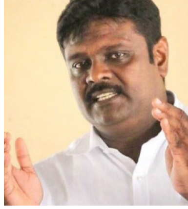
தால் மாத்திரமே அதற்கு ஆதரவாக வாக்களிப்போம்-என்றார். (ஐ)

தற்போது முன்வைக்கப்பட்டுள்ள புதிய அரசமைப்பு தொடர்பான நியூனார் குழுவின் அறிக்கை சரியான முறையில் இறுதிப்படுத்தப்படவேண்டும். தமிழ் மக்கள் தங்களைத் தாங்களே ஆளும் வகையில் அரசமைப்பில் மாற்றம் கொண்டுவர