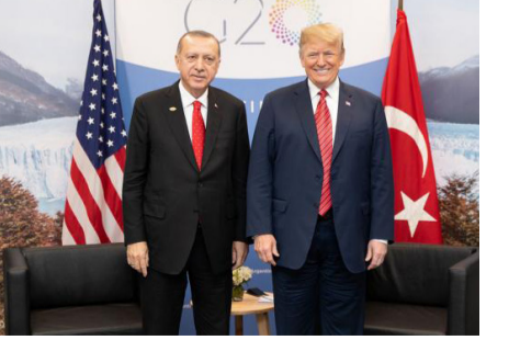
உள்ளிட்ட பல்வேறு விவகாரங்கள் தொடர்பாகவும் ஆலோசித்தனர் என கூறப்பட்டுள்ளது.

கொண்டனர். இது தொடர்பாக வெள்ளை மாளிகை வெளியிட்டுள்ள அறிக்கையில், 'சிரியாவில் எஞ்சியுள்ள பயங்கரவாத சக்திகளை தோற்கடிப்பதன் முக்கியத்துவம் குறித்து ட்ரம்ப் குறிப்பிட்டுள்ளார். வடகிழக்கு சிரியா மற்றும் எல்லைப்பகுதியில் பாதுகாப்பு இலக்கை அடைவதற்காக தொடர்ந்து பேச்சு நடத்த இரு நாட்டின் தலைவர்களும் ஒப்புக் கொண்டுள்ளனர். மேலும், அமெரிக்கா, துருக்கி இடையிலான வர்த்தக உறவை மேம்படுத்துவது