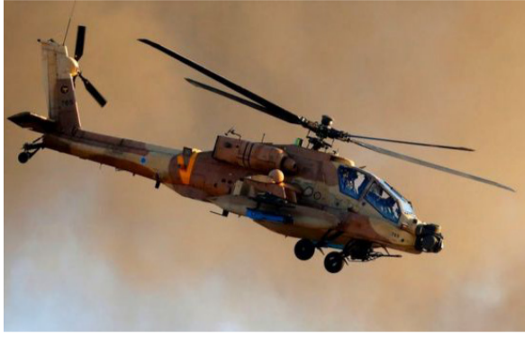
சிரியாவில் உள்ள கோலான் மலைப் பகுதி உச்சியில் உள்ள இலக்குகளில் இருந்து ஏவப்பட்ட ஒரு ரொக்கெட்டை

லண்டன், ஜன. 22 சிரியாவில் உள்ள ஈரானின் இலக்குகளை தாங்கள் தாக்கத் தொடங்கிவிட்டதாக இஸ்ரேல் இராணுவம் தெரிவித்துள்ளது. இந்தத் தாக்குதலில் 11 பேர் உயிரிழந்துள்ளனர் என தகவல்கள் தெரிவிக்கின்றன. ஈரானிய புரட்சிப் படையின் சிறப்பு பிரிவான குட்ஸ் படைக்கு எதிராக தங்களின் தாக்குதல் நடவடிக்கை அமைந்ததாக இஸ்ரேல் பாதுகாப்பு படைப் பிரிவு (IDF) கூறியுள்ளது. மேலும், இது குறித்து எந்த தகவலையும் இஸ்ரேல் ராணுவம் தெரிவிக்கவில்லை. ஞாயிற்றுக்கிழமையன்று