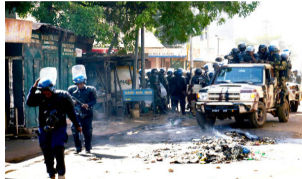
கும் இடங்களின்மீது அதிரடியாக தாக்குதல் நடத்தி வந்தனர்.

பமாக் கோ, ஜன. 22 மாலி நாட்டில் ஐக்கிய நாடுகள் சபையின் அமைதிப்படை முகாம் மீது பயங்கரவாதிகள் நடத்திய தாக்குதலில் 10 வீரர்கள் உயிரிழந்தனர் என்றும், 25 பேர் காயமடைந்துள்ளனர் என்றும் ஐ.நா தகவல் தெரிவித்தது. மேற்கு ஆபிரிக்க நாடான மாலியின் வடக்கு பகுதியை 2012 ஆம் ஆண்டு மத அடிப்படையிலான பயங்கரவாதிகள் கைப்பற்றினர். அவர்களை 2013 ஆம் ஆண்டு பிரெஞ்சு படையினர் விரட்டியடித்தனர். ஆனாலும் மாலியில் தொடர்ந்து உள்ளாட்டு போர் நடந்து வருகிறது. அங்குள்ள பயங்கரவாத குழுவினர் பிரபல அரசியல்வாதிகள், அமைச்சர்கள், அரசு அதிகாரிகள் மற்றும் செல்வந்தர்கள் தங்கியிருக்கும் இடங்களின்மீது அதிரடியாக தாக்குதல் நடத்தி வந்தனர்.