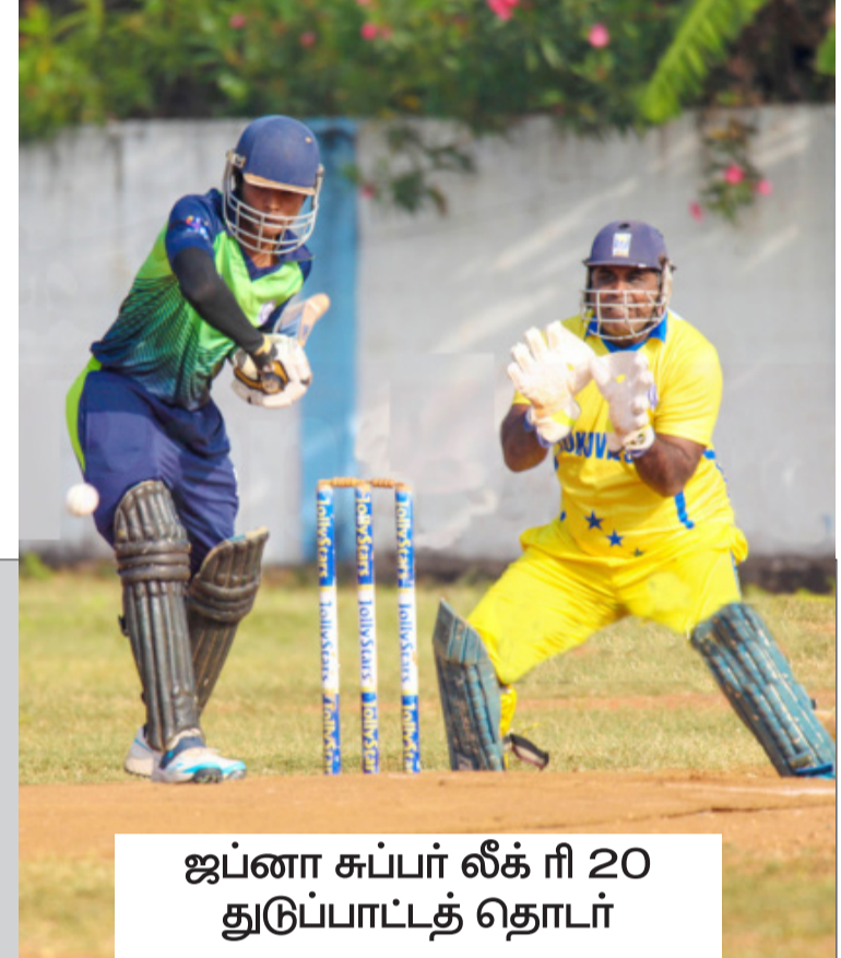
ஜப்னா சுப்பர் லீக் ரி 20 துடுப்பாட்டத் தொடர்