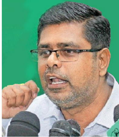
சபைத் தேர்தலை அல்ல ஜனாதிபதித் தேர்தலையே அவர்கள் கோரவேண்டும் - என்றார். (ஐ)

கில்லை. தேசிய அரசின்போது யாருடைய தேவைக்காகத் தேர்தல் பிற்போடப்பட்டது என்று தெரியும். தேர்தலை நடத்துவதில் எவ்வித சிக்கலும் இல்லை. மாகாண சபை புதிய முறையில் நடத்துவது தாமதமாயின் பழைய முறையில் நடத்துவோம். அதில் எவ்வித ஆட்சேபமும் இல்லை. நாட்டில் அரசியல் நெருக்கடி காணப்படுவதாகவே எதிர்க்கட்சிகள் கூறி வருகின்றன. அவ்வாறாயின் ஜனாதிபதித் தேர்தலுக்குச் செல்வோம். எம்மைப் பொறுத்தவரை நாட்டில் எவ்வித நெருக்கடிகளோ, குழப்பங்களோ இல்லை. ஆனால், எதிர்க்கட்சிகள் நெருக்கடி இருப்பதாகக் கூறுவார்களாயின் மாகாண