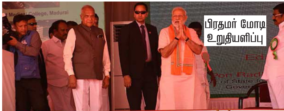
பிரதமர் மோடி உறுதியளிப்பு

பீட்டில் 89 ஆயிரம் பேர் சிகிச்சை பெற்றுள்ளனர். 2025 என்ற தொலைநோக்கு திட்டத்தை மத்திய அரசு சிறப்பாக