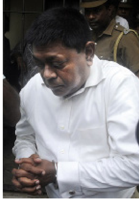
டைவார் என்று எதிர்பார்க்கப்படுகிறது. கொலம்பியா மாவட்ட நீதிபதி தலைமையில் அன்று காலை 10.45 மணிக்கு

இந்த நிலையில் நாளை செவ்வாய்க் கிழமை அமெரிக்க நீதிமன்றத்தில் சரண