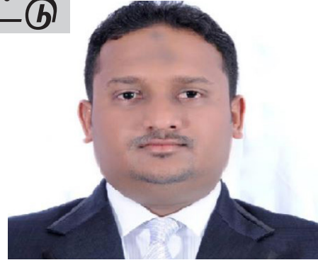
நடத்துவதற்கு நாடாளுமன்றத்தின் ஊடாக நடவடிக்கை மேற்கொள்ள வேண்டும் எனத் தெரிவித்துள்ளார்.

எனவே மீள் எல்லை நிர்ணயம், புதிய தேர்தல் முறை தொழிநுட்பம் ஆகியவற்றில் சிக்கல் காணப்படுவதாக கூறி தேர்தல் நடத்துவதனை காலம் தாழ்த்தாமல் பழைய தேர்தல் முறையில் தேர்தலை