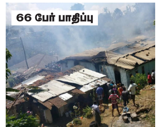
66 பேர் பாதிப்பு

பாதிக்கப்பட்டவர்கள் தற்காலிகமாக தோட்டத்தின் கலாசார மண்டபத்தில் தங்க வைக்கப்