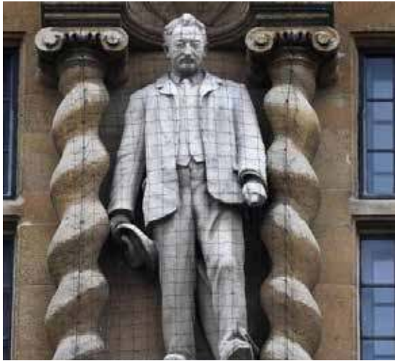
இனவெறி எதிர்ப்பின் எதிரொலி