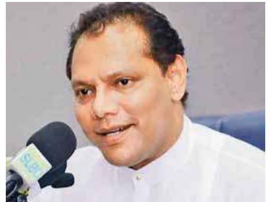
நியமிக்கப்படுவார்கள் என்றும் அவர் தெரிவித்துள்ளார்.

அதனாலேயே இங்கு தனித்துப் போட்டியிடுகின்றோம். இனிக் கவலைப்பட்டுப் பயனில்லை. இங்குள்ள சுதந்திரக்கட்சி உறுப்பினர்கள் கட்சியின் வேட்பாளர்களைத்தான் ஆதரிக்கவேண்டும். மாற்றுத் தரப்புகளுக்கு ஆதரவு வழங்கினால் கட்சி உறுப்புரிமை நீக்கப்படும். பிரதேச சபை உறுப்பினர்களாக இருப்பவர்களின் பதவி பறிக்கப்பட்டு புதியவர்கள்