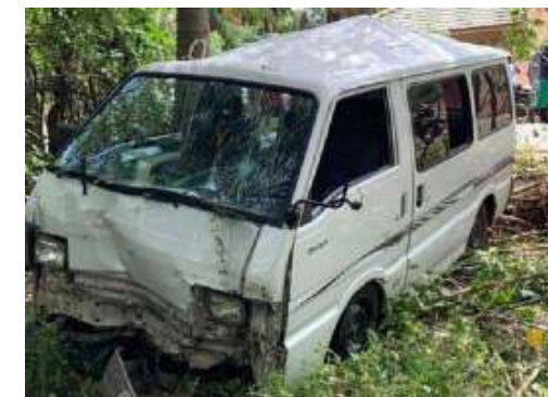
பருத்தித்துறை, ஜூன் 23 பருத்தித்துறையில் இருந்து யாழ்ப்பாணம் நோக்கிப் பயணித்துக் கொண்டிருந்த ஹயஸ் வான் விபத்தில் கலந்துகொண்டிருந்தவர்கள்.

ருந்தஹயஸ்வானின் பயர்வெடித்ததில் அந்த வான் வீதியை விட்டு விலகித் தென்னைமரத்துடன்தோதிக்காணிக்குள் பாய்ந்து விபத்துக்குள்ளானது. இந்தச் சம்பவம் நேற்று நண்ப கல் 12.30 மணியளவில் நீர்வேலி கந்தசுவாமி கோயிலுக்கு அண்மையில் இடம்பெற்றது.