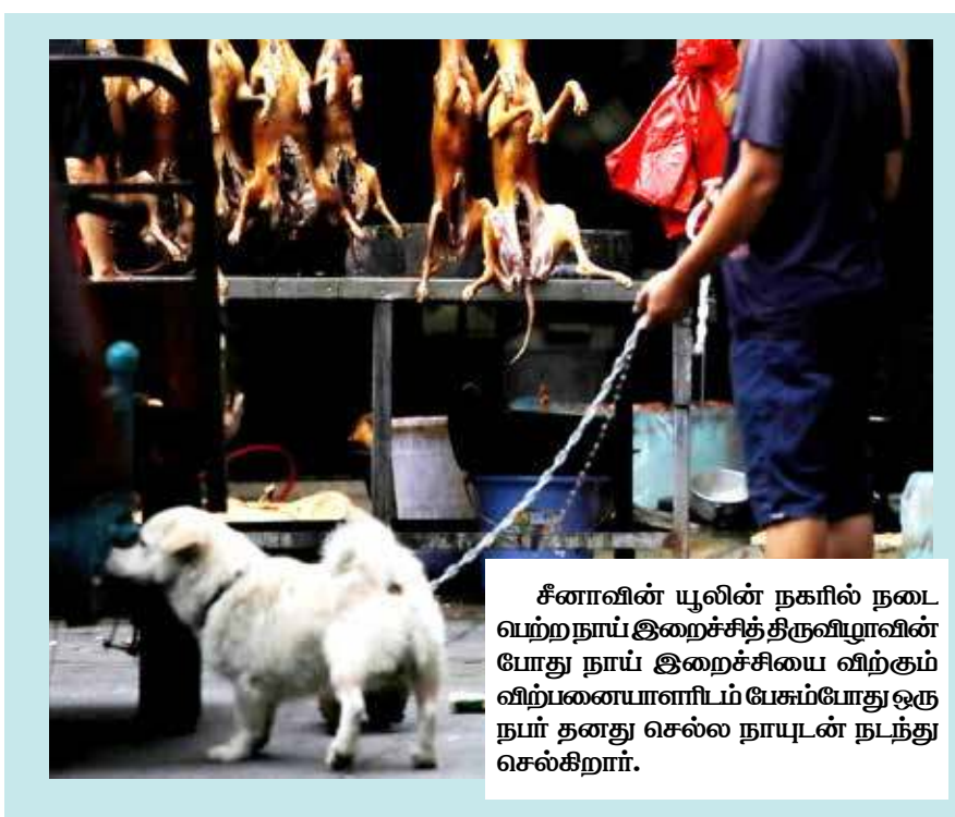
சீனாவின் யுலின் நகரில் நடைபெற்ற நாய் இறைச்சித் திருவிழாவின் போது நாய் இறைச்சியை விற்கும் விற்பனையாளரிடம் பேசும்போது ஒரு நாய் தனது செல்ல நாயுடன் நடந்து செல்கிறார்.

கடந்த 11ஆம் திகதியில் இருந்து 20ஆம் திகதி வரை 22 லட்சத்து 90 ஆயிரம் பேருக்குக் கொரோனா பரிசோதனை செய்யப்பட்டுள்ளது. அங்குள்ள உணவுச் சந்தைகளில் கொரோனா தாக்கம் உணரப்பட்ட நிலையில், குறிப்பாக, உணவு விநியோக நிறுவனங்கள், உணவு வகங்கள் ஆகியவற்றின் ஊழியர்களைக் குறிவைத்தே அங்கு பரிசோதனை நடத்தப்படுகிறது.