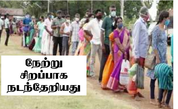
நேற்று சிறப்பாக நடந்தேறியது

ஆலயத்திற்கு செல்லும் பிரதான நுழைவாயில் வீதியில் பக்தர்கள் நிறுத்தப்பட்டு சுகாதார வழிமுறைகளை