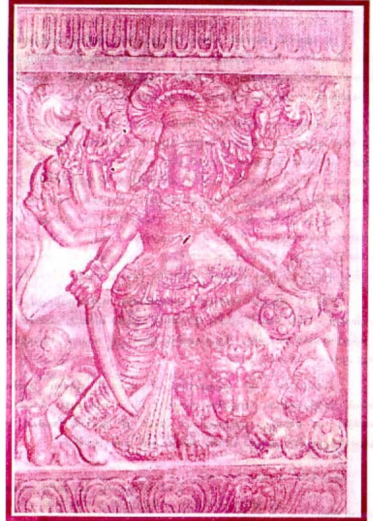
10சீடாகுர வர்த்தனேச் சீறயம் (நீர்வேல் கந்தசாமக்கோயில் தேர்)

பிற்குறிப்பு:- இக் கட்டுரையில் குறிப்பிடப்பட்டுள்ள செய்திகள் யாவும், ஐயாவிடமிருந்தும், இளமை காலம் தொட்டு அவருடன் பழகியவர்களிடமிருந்தும் பெறப்பட்டவை.