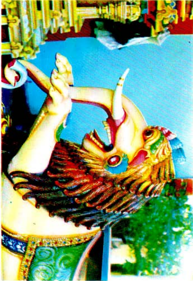
மகரம் (பரராசசேகர்பீள்ளையார் கோவில்)