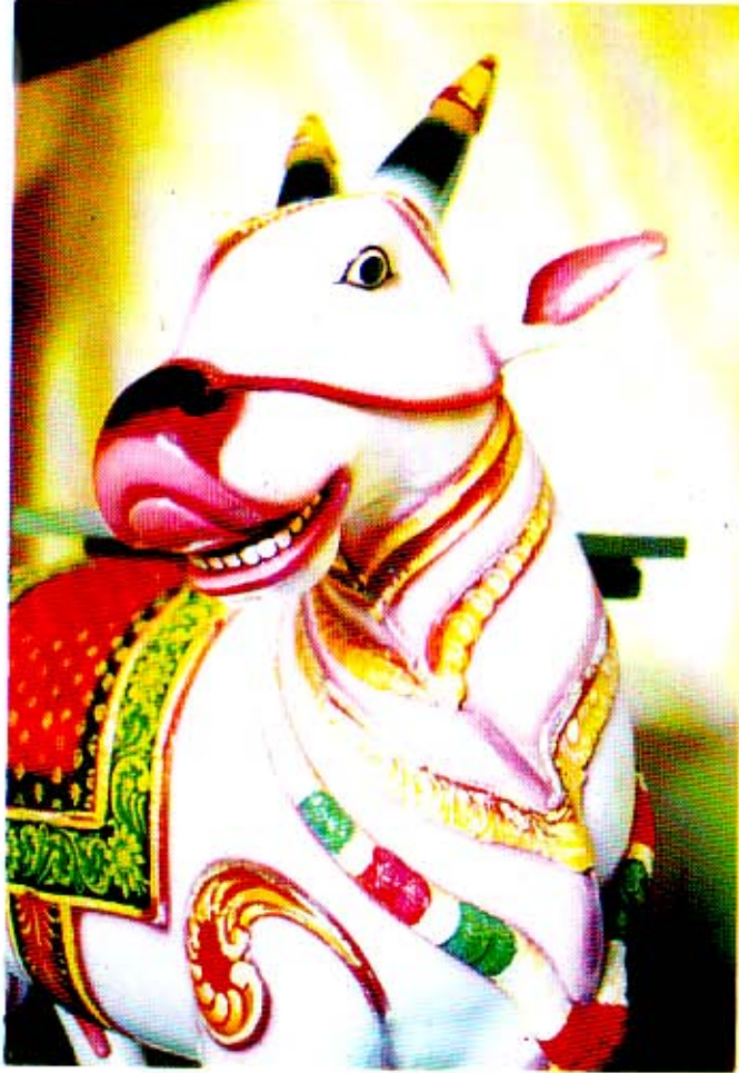
இடமம் (பரராசசேகர்ஸ்ஸையார் கோவில்)

போனால் முட்ட வருமோ என்று எண்ண வைக்கக் கூடிய அளவுக்கு அதன் ஆக்ரோசமும், ஆண்மை வெளிப்பாடும் மிக அற்புதமாக வெளிப்பட்டிருக்கும் சிற்பம் அது.