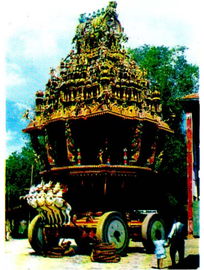
இணுவில் மஞ்சம் (புணரமைப்பு)

முன்னேஸ்வரம், சுட்டிபுரம், நயினை, நீர்வேலி சுந்தர சுவாமி கோவில், இணுவில் போன்ற ஆலயங்களில் அமரர் அவர்களின் தலைமையின் கீழ் பல கலைஞர்களுடன் நானும் தொழில் பயின்றிருக்கின்றேன். தொழிலைப் பயிற்றுவின்ற தன்மை இவருக்கு நிகர் இவரேதான். கடமை, கண்ணியம், அன்பு, ஆளுமை, உறுதிமிக்க ஒரு சில மனிதர்களுள் இவரும் ஒருவர். மிகுந்த அன்போடு தொழில் கற்பித்து நீங்களும் கலை உலகில் தலைநிமிர்ந்து வாழலாம் எனப் பல இளைஞர்களை வாழவைத்தவர். கலை உலகில் தனக்கென ஒரு இடத்தைப் பெற்றவர். 'மிறுக்கன் சரக்கு இருக்க விலைப்படும்' என்ற முதுமொழிக்கேற்ப தொழிலைச் செய்தவர். தொழிலையோ, புகழையோ இவர் நாடிச் சென்றதில்லை. தேரென்றால்